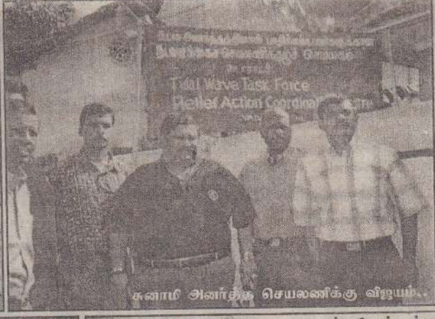
கனாமி அனாதை செயலணிக்கு விஜயம்