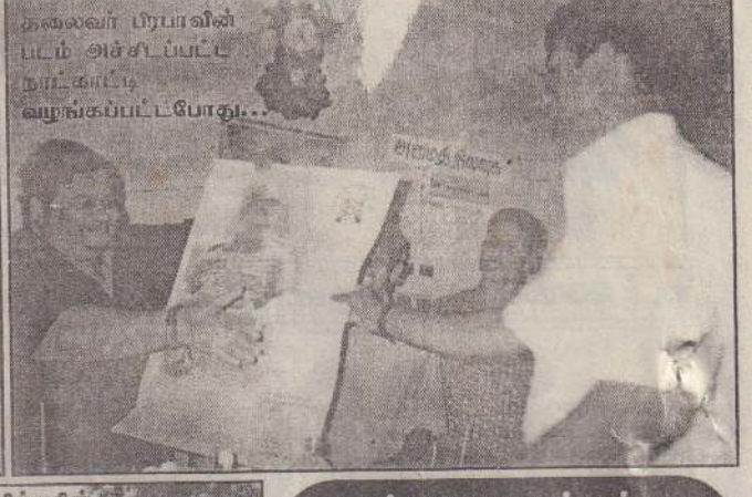
தலைவர் பிரபாவின் படம் அச்சிடப்பட்ட நாடகம் வழங்கப்பட்டபோது...