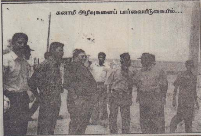
கனாமி அழிவுகளைப் பார்வையிடுகையில்...