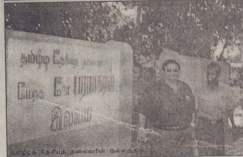
தமிழ்த் தேசியத் தலைவரின் இல்லத்தில்...