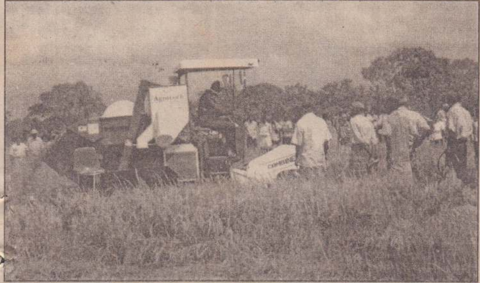
வன்னிவேளாண் தொழில்நுட்ப நிறுவனம் விவசாயிகளுக்காக நெல்அறுவடை கியந்திரம், நெற்கதிரை குடுமித்தீக்கும் கிணைந்த பொறி என்பனவற்றை அறிமுகம் செய்யவுள்ளது. அந்த கியந்திரத்தின் மூலம் நெல் அறுவடை செய்யப்படுவதைப் படத்தில் காணலாம்.