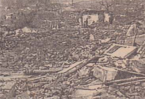
நிலநடுக்கத்தால் சீதைந்துபோன ஈரானின் குடியிருப்பு பகுதிகளின் காட்சி இது...

தெஹ்ரான், பெப். 23 ஈரானில் நேற்று அதிகாலை சக்திவாய்ந்த நிலநடுக்கம் தாக்கியது. இதில் 400 பேர் உயிரிழந்தனர்; 100 இற்கும் அதிகமானவர்கள் காயமடைந்தனர். மேலும் பல கிராமங்கள் முற்றாகச் சேதமடைந்தன என்று அரசு தொலைக்காட்சி அறிவித்தது.