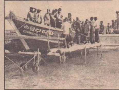
லாம் எனக் கூறிச்சென்றார். கச்சதீவுக்கு வந்திருந்த இந்தியர்களில் இளைஞர்கள், இளம் பெண்கள் என 18 முதல் 40 வயதுக்கு உட்பட்ட அநேகர் இருந்தனர். முதல் தடவையாக இங்குவரும் இந்த இளசு