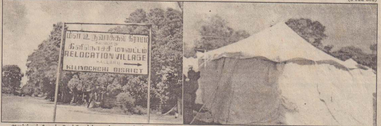
அனர்த்தத்தினால் கிடம்பெயர்ந்த மக்களை மீள்க்குடியமர்த்தவென கண்டாவளைப் பிரதேச செயலர் பிரிவுள்ள கல்லாறுக் கிராமத்தில் அமைக்கப்பட்டுள்ள மீள் உருவாக்கல் கிராமத்தின் பெயர்ப்பலகையையும், தற்காலக் கூடாரம் ஒன்றையும் படங்களில் காணலாம்.

ததாவது:- எது மாவட்டத்திலுள்ள சங்கங்கள் குழந்தைகளுக்கான பால்மா வகைகளை வைத்துக் கொண்டு இல்லை எனக் கூறி வருவதாக எனக்கு முறைப்பாடுகள் கிடைத்துள்ளன.