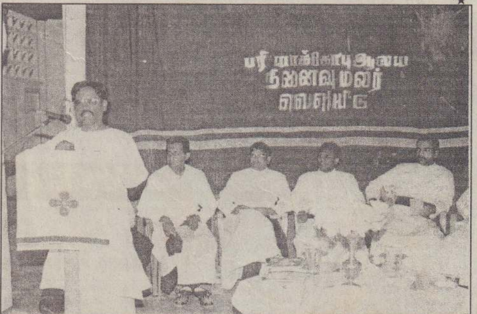
நல்லூர் புனித யாக்கோபு ஆலயத்தின் 175 ஆவது ஆண்டு நினைவு மலர் வெளியீட்டு விழாவின்போது எடுக்கப்பட்ட படம் இது.

நாட்டு மக்களிடையே மேன்மேலும் பிரிவினையை உக்கிரமடையச் செய்யும் பொதுஜன அபிப்பிராய வாக்கெடுப்பு போன்ற ஒன்றை நாட்டில் நடத்த முயல்வது, அத்தகைய ஒன்றின் மூலம் சமூகங்கள் சிதறிப்போகக் கூடிய மேலுமோர் அதிபயங்கர அழிவுக்கு வழிவகுக்கக் கூடிய அதிக வாய்ப்புகளை உருவாக்கும்.