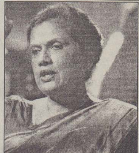
பான்மைப் பலத்தோடு பலம் பொருந்திய அரசாக இயங்கியது.

ஏனெனில், தற்போதைய அரசமைப்புக்கு அமைய ஒருவர் இரு தடவைகள் மாத்திரமே ஜனாதிபதிப் பதவியை வகிக்க முடியுமென அரசமைப்பில் தெளிவாகக் குறிப்பிடப்பட்டுள்ளது. ஆனால், நாம் அது தொடர்பாக மாத்திரம் கவனத்தில் கொள்ள இயலாது. அந்த வாக்கெடுப்பு இடம்பெற்ற காலகட்டத்தில் பதவியிலிருந்த அரசு இலங்கை அரசியல் வரலாற்றில் பலம் பொருந்திய அரசாக இயங்கி வந்தது. அன்றிலிருந்த அரசும் 5/6 அறுதிப் பெரும்