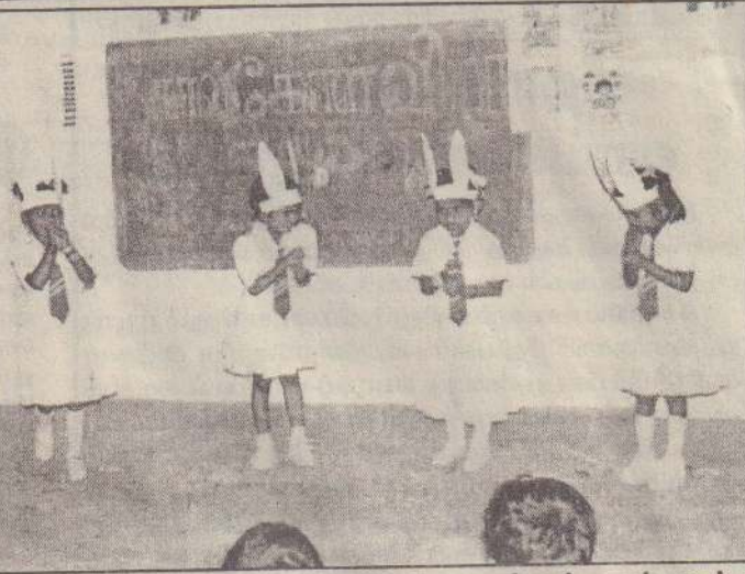
மட்டுவில் சாந்தநாயகி வித்தியாலயத்தின் தரம் ஒன்று மாணவர்களை வரவேற்கும் கால்கோள் விழாவில் புதிய மாணவர்களையும் விருந்தினர்களையும் வித்தியாலய மாணவிகள் வரவேற்று நடனமாடுவதைப் படத்தில் காணலாம்.