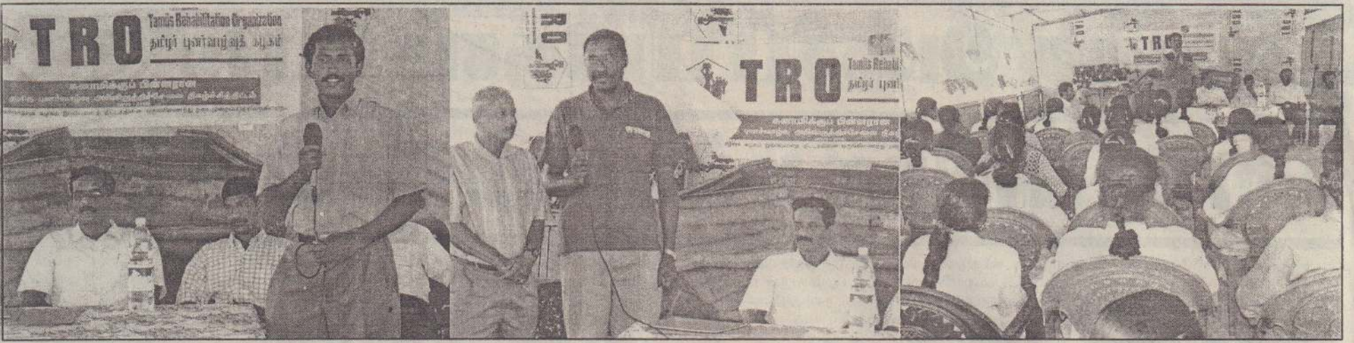
வடமராட்சி கிழக்கு நெல்லியானில் படகு உற்பத்தி மையம் திறந்துவைக்கப்பட்டது. இந்நிகழ்வில் தமிழர் புனர்வாழ்வுக் கழகப் பிரதிநிதி, அகதிகளுக்கான ஐ.நா.கூதரக பிரதிநிதி ஆகியோர் உரையாற்றுவதையும், கலந்துகொண்டவர்களையும் படங்களில் காணலாம்.