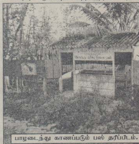
பாழடைந்து காணப்படும் பஸ் தரிப்பிடம்.

ஸ்கந்தபுரம்,மாள்8 ஸ்கந்தபுரம் சந்தியிலுள்ள பஸ்தரிப்பிடம் சேதமடைந்து காணப்படுவதால் பயணிகள் பெரும் சிரமங்களை எதிர்நோக்கவேண்டி ஏற்படுவதாக முறைப்பாடு தெரிவிக்கப்படுகிறது. இந்தச் சந்தியில் மாவீரர் ஒருவரின் ஞாபகார்த்தமாகப் பயணிகள் தரிப்பிடம் ஒன்று அமைக்கப்பட்டது. அது தற்போது சேதமடைந்து பயன்படுத்தமுடியாத நிலையில் உள்ளது. இதனால் பயணிகள் தனியார் உணவகம் ஒன்றின் முன் பஸ்ஸ்காகாகக் காத்து நிற்க வேண்டியுள்ளது. சேதமடைந்த இந்தப் பஸ்தரிப்பிடத்தைச் சீரமைத்துப் பயணிகளின் பாவனைக்குத்வ சம்பந்தப்பட்டவர்கள் நடவடிக்கை எடுக்கவேண்டுமென்ப பொதுமக்கள் கோரிக்கை விடுத்துள்ளனர்.