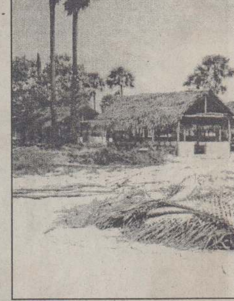
வடமராட்சி கழக்கு உடுத்துகிற சமைதாங்கிக் கிராமத்தில் தமிழர் புனர்வாழ்வுக் கழகத்தினர் 18 அடி நீளமும் 12 அடி அகலமும் உடைய 350 வீடுகளை அமைத்து வருகின்றனர். அவர்களால் அமைக்கப்பட்டு வரும் வீடுகளைப் படத்தில் காணலாம்.

வட்டக்கச்சி,மாள்8 கிளிநொச்சி மாவட்ட தொழில்நுட்பக் கல்வி நிறுவனத்தால் நடத்தப்படும் பயிற்சி நெறிகள் முல்லைத்தீவு மாவட்டத்திற்கும் விஸ்தரிக்கப்பட்டுள்ளன. இத்திட்டத்தின் ஒரு கட்டமாக கடந்த 28ஆம் திகதி போருட் நிறுவனத்தின் அனுசரணையுடன் வள்ளிபுனத்தில் மரவேலைப் பயிற்சி நெறியும் கைவேலியில் மேசன் பயிற்சி நெறியும் ஆரம்பிக்கப்பட்டுள்ளன.