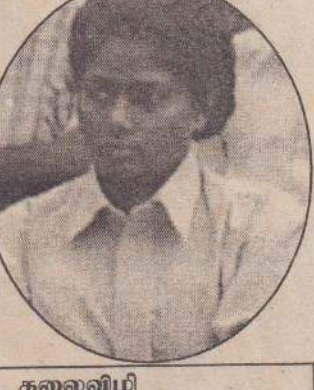
கலைவிழி (யாழ்.மாவட்ட அரசியல்வாதியைப் பொறுப்பாளர்)

களில் பெண்கள் சைக்கிள் ஓடக்கூடாது; வேலைக்குப் போகக் கூடாது என்ற கட்டுகளைப் போட்ட சமூகம் இன்றைய பொருளாதாரத் தேவைகள் காரணமாக அவற்றை ஏற்றுக்கொள்கின்றது. பெண் ஒருத்தி தனது குடும்பத்திற்காக இறக்கும் வரை போராடிக் கொண்டே இருக்கின்றாள். அந்த நிலையில் பெண்ணுக்குள்ளும் மனிதம், மனது உள்ளது என்று எவராவது அவளை மதித்தால் அந்த நிமிடமே பெண் வெற்றியடைந்து விடுகின்றாள். சமூகத்தில் எமக்கான ஓர் இடம் தானாகக் கிடைக்க வேண்டும். சமூகம் தனது தேவைக் கேற்ப பெண்ணின் கட்டுகளைத் தளர்த்தும் போது, அவற்றைப் பயன்படுத்த வேண்டும். பொருளாதாரம் ஒரு நாட்டின் நிலையைத் தீர்மானிக்கின்றது. சமூகத்தில் உள்ள ஒவ்வொரு பெண்ணும் தனது குடும்பத்திற்கான பொருளாதார வசதிகளை ஏற்படுத்திக் கொடுக்கும் போது அவளை அச்சமூகமே ஏற்றுக் கொள்கின்றது. இந்நிலைகளில் பெண்களின் ஆளுமைகள் வெளிக்கொண்டு வரப்படுகின்றன. இந்த மகளிர் தினத்தை முன்னிட்டு யாழ்ப்பாணத்தில் பெண்களுக்குப் பயன்தரக் கூடிய சட்டங்களை வெளிப்படுத்துவதற்காக. கிராம மட்டத்தில் இருந்து இந்தச் சட்டமுறைகளை அறிமுகம் செய்யவுள்ளோம்.