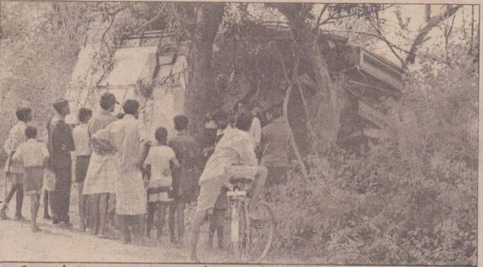
ஜெயபுரம் சி.த.க.பாடசாலை முன்பாக இடம்பெற்ற விபத்தில் லொரீ ஒன்று வீதியை விட்டு விலகி மரங்களுடன் மோதுண்டு நிற்பதைப் படத்தில் காணலாம். இந்த விபத்தில் லொரீயின் முன்பக்கம் முற்றாகச் சேதமடைந்துவிட்டது. எனினும் சாரதி மயிரிழையில் உயிர் கப்பினார்.

முல்லைத்தீவு, மன்னார் மாவட்டங்களிலுள்ள செஞ்சிலுவைச் சங்கப் பணியாளர்களுக்கான பயிற்சிகளுக்காக இந்த நிலையம் அமைக்கப்பட்டிருக்கின்றது. வடபகுதியின் 5 மாவட்டங்களுக்கும் வயப்படுத்தப்பட்ட இடமாக கிளிநொச்சி மாவட்டம் இருப்பதாலேயே மேற்படி பயிற்சி நிலையத்தைக் கிளிநொச்சியில் அமைக்கத் தீர்மானித்திருப்பதாக அதன் தலைவர் மேலும் தெரிவித்தார். (த-305)