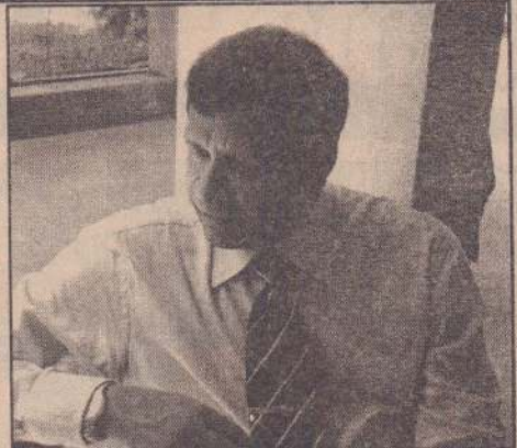
கள் செல்வதற்கு வாய்ப்புகள் கிட்டுவதில்லை என முறைப்பாடு கூறப்படுகின்றது அது குறித்து?

யாழ்.கிரிக்கெட் சங்கத்தின் திட்டங்கள் குறித்து இக்குழு ஆராயவிருக்கின்றது. ☐ கேள்வி: யாழ்ப்பாணத்தில் சிறந்த வீரர்கள் இருந்தபோதும் சர்வதேச மட்டத்தில் அவர்