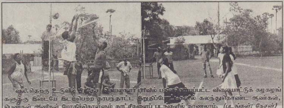
வலி.தெற்கு உடுவில் சிந்தை செயலாளர் பிரிவில் பல்விளையாட்டுக் கழகங்கள் களத்தில் இடம்பெற்ற கரபந்தாட்ட இறுதிப்போட்டிகளில் கலந்துகொண்ட ஆண்கள், பெண்கள் அணிகள் மோதிகொள்ளும் காட்சிகளைப் படங்களில் காணலாம்.

வலி.தெற்குப் பிரதேச செயலாளர் பிரிவில் பதிவுசெய்யப்பட்ட விளையாட்டுக் கழகங்களுக்கு இடையே இடம்பெற்ற ஆண்கள், பெண்களுக்கான கரபந்தாட்டப் போட்டியில் ஆண்கள் பிரிவில் இணுவில் இந்து விளையாட்டுக் கழகமும் பெண்கள் பிரிவில் சன்னாகம் மயிலணி வளர்ப்பறை விளையாட்டுக் கழகமும் சம்பியனாகத் தெரிவுசெய்யப்பட்டன. உடுவில் மத்தி விளையாட்டுக்கழக மைதானத்தில் இப்போட்டிகள் நேற்றுமுன்தினம் இடம்பெற்றன. பெண்களுக்கான இறுதிப்போட்டியில் சன்