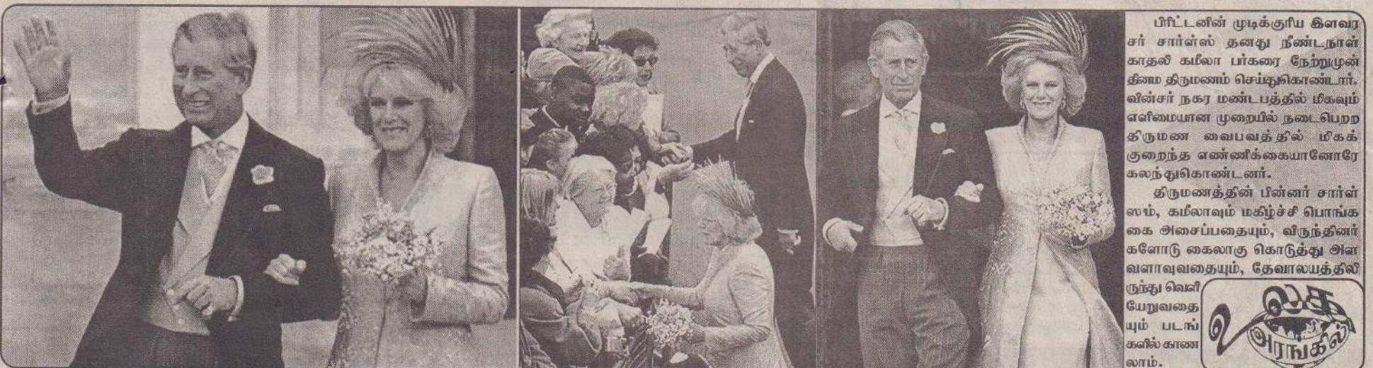
மீட்டனின் முடிக்குரிய கிளவர சர் சார்ள்ஸ் தனது நண்பரான காதலி கமீலா பங்கரை நேற்றுமுன் திமை திருமணம் செய்துகொண்டார். வீன்சர் நகர மண்டபத்தில் மிகவும் எளிமையான முறையில் நடைபெற்ற திருமண வைபவத்தில் மிகக் குறைந்த எண்ணிக்கையானோரே கலந்துகொண்டனர்.

களித்துச் செல்லும் தலமாகச் சிறப்புப் பெற்று விளங்குகின்றது. பங்குனி நாளில் அதிகாலை யில் எழுந்து ஆலயத் தீர்த்தக் கேணியில் நீராடி முறைப்படி விரதமனுட்டித்து வழிபாடி யற்றியே தத்தம் வேலைகளுக்குச் செல்வர். அரசு உத்தியோகத்தர்கள், படையினர், பொலீஸார் கூட இவ் ஆலயத்தின் மீது பக்தி சிரத்தையுடன் நடந்துகொள்வதை ஆலயச் சூழலில் காணமுடிகின்றது.