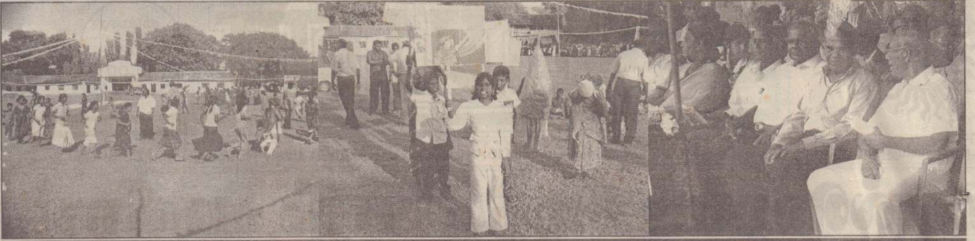
நேற்று இடம்பெற்ற அரியாலை 86ஆவது சுதேசிய திருநாட்கொண்டாட்ட விழாவில் எடுக்கப்பட்ட படங்கள் கிடை. கிசை அசைவு நிகழ்வு இடம்பெறுவதையும், வினோத ஆடை நிகழ்வில் கலந்துகொண்ட ஒரு பகுதியினரையும் விருந்தினர்கள் அமர்ந்திருப்பதையும் படங்களில் காணலாம்.