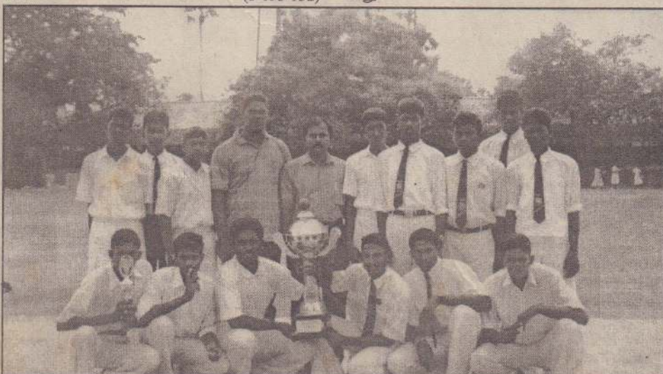
தெல்லிப்பறை மகாஜனக் கல்லூரிக்கும் சுந்தரோடை ஸ்கந்தவரோதயக் கல்லூரிக்கும் இடையில் அண்மையில் இடம்பெற்ற மாபெரும் துடுப்பாட்டப் போட்டியில் வெற்றிபெற்ற ஸ்கந்தவரோதயக் கல்லூரி அணி தமது விளையாட்டுக்குறைப் பொறுப்பாசிரியர், பயிற்றுநர் சகிதம் வெற்றிக் கணத்துடன் காணப்படுகின்றனர். (3-190)

ஊர்காவற்றாரை புனித அந்தோனியார் கல்லூரியில் இப்போட்டிகள் நடைபெற்றன. (3-51)