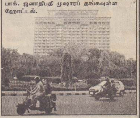
பாக். ஜனாதிபதி முஷாரப் தங்கவுள்ள ஹோட்டல்.

புதுடில்லி வரும் முஷாரப் அங்குள்ள தாஜ் ஹோட்டலில் தங்குகிறார். அவருக்காக ஹோட்டலின் 9ஆவது மாடியில் 70 அறைகள் ஒதுக்கப்பட்டுள்ளன. இதில் முஷாரப் அவரது மனைவி சொபா மற்றும் பாகிஸ்தான் பிரதிநிதிகள் தங்குவர். முஷாரப் வருகையை முன்னிட்டு புதுடில்லியில் பலத்த பாதுகாப்பு ஏற்பாடுகள் செய்யப்பட்டுள்ளன. கிரிக்கெட் ஸ்டேடியம், அவர் தங்கும் இடம், மற்றும் சுற்றுப் பயணம் செய்யும் இடங்களைப் படையினர் தங்கள் வசம் பொறுப்பேற்று பாதுகாப்பு ஏற்பாடுகளைச் செய்துள்ளனர். விளையாட்டு அரங்கின் உள்ளேயும், வெளியேயும் படையினர் குவிக்கப்பட்டுள்ளனர். படையினர் சாதாரண உடையிலும் கண்காணிப்புப் பணியில் ஈடுபட்டுள்ளனர். பாதுகாப்புக் கருதி கிரிக்கெட் போட்டி நடைபெறும் மைதானத்தின் அருகே முஷாரப்பும், மன்மோகன் சிங்கும் ஹெலிகொப்டரில் வந்து இறங்குவர். அங்கிருந்து குண்டு துளைக்காத காரில் அவர்கள் மைதானத்தை வந்தடைவர். (எ)