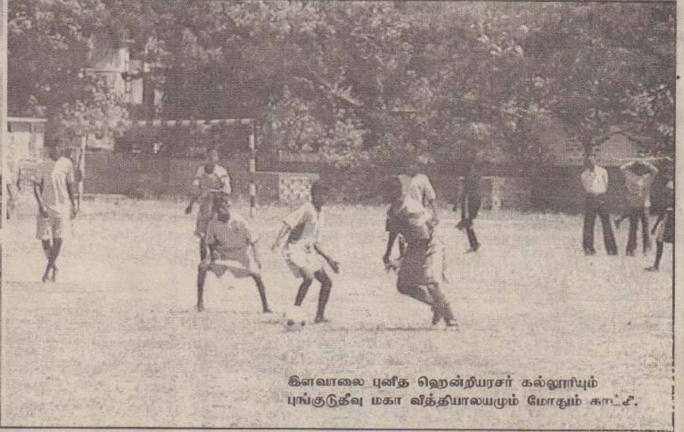
கிளவாலை புனித ஹென்றியர்ஸ் கல்லூரியும் புங்குடுதீவு மகா வித்தியாலயமும் மோதும் காட்சி.