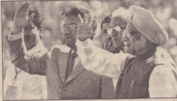
அப்போது முஷாரப்பின் பாகிஸ்தான் வெளிவிவகார அமைச்சர் குர்ஷீத் முகமது சகூரி, தகவல் தொடர்புத்துறை அமைச்சர் ஷேக் ரஷீத் அகமது ஆகியோரும் இருந்தனர்.

அஜ்மீர் பள்ளிவாசலில் முதன்முறையாகத் தொழுகை நடத்த எனக்கும் என் மனைவிக்கும் என்னுடன் வந்துள்ள ஏனைபோருக்கும் கிடைத்த இந்த வாய்ப்பைப் பெரும் கௌரவமாக நினைக்கிறேன் என்றும் கூறினார்.