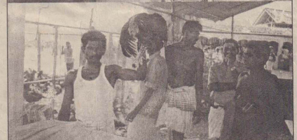
புளியம்பொக்கணை நாகதம்பிரான் ஆலய பொங்கல் திருவிழா கடந்த மாதம் 28 ஆம் திகதி நடைபெற்றது. அதன்போது நேர்த்திகள் வைத்த பக்தர்கள், ஆயிரக்கணக்கான கோழிகளை ஆலயத் திற்குக் கொண்டுசென்று தானமாகக் கொடுத்தனர். அவ்வாறு கோழிகளை பக்தர்கள் ஒப்படைப்பதையும் - அவ்வாறு ஒப்படைக்கப்பட்ட கோழிகள் ஏலத்தில் வீற்கப்படுவதையும் படங்களில் காணலாம்.