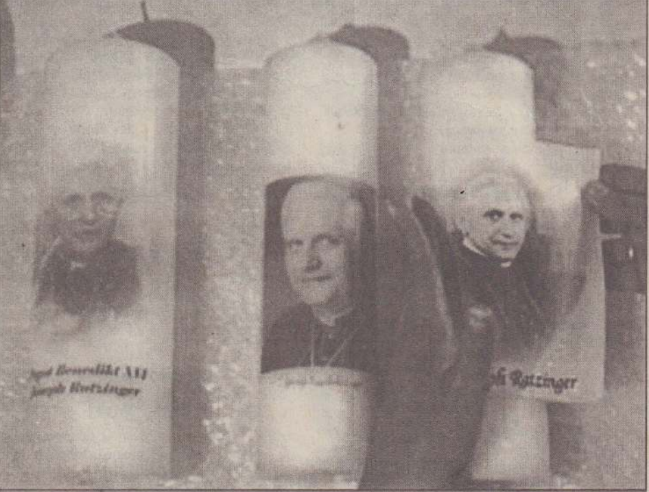
புதிய பாப்பரசராகத் தேர்ந்தெடுக்கப்பட்ட 16ஆம் பெனடிக்ஸ் இன்று வத்திக்கானில் முறைப்படி பதவி ஏற்கிறார். இதையொட்டி ஜேர்மனியில் அவரது படம் பொறித்த மெழுகுவர்த்திகள் பெருமளவில் விற்பனைக்கு வந்துள்ளன. இந்த மெழுகுவர்த்திகள் அமேரிக்காவின் விற்பனையாகின்றன. மெழுகுவர்த்தி உருக்கலும் பாப்பரசரின் படம் போட்ட உறை கரைந்து போகாதவாறு அமைக்கப்பட்டுள்ளது. அகையே படத்தில் காண்கிறார்கள். (8)

பிலிப்பைன்ஸ் தலைநகர் மணிலாவில் சி.என்.என். தொலைக்காட்சிக்கு அவர் பேட்டி அளித்தார். அதன் விவரம் வருமாறு:- காஷ்மீர் முழுவதையும் ஏழு பகுதிகளாகப் பிரித்து அடையாளம் கண்டு, உடன்பாடு ஏற்பட்டு, அப்பகுதியிலிருந்து இராணுவத்தை வاپஸ் பெறவேண்டும். அதன்பின் அந்தப் பகுதியின் ஆட்சியின் தன்மையை மாற்றவேண்டும். இவற்றை நிறைவேற்ற அப்பகுதியில் இராணுவம், பயங்கரவாதம் அல்லது விடுதலைப் போராட்டம் போன்ற எதுவும் இருக்கக்கூடாது. காஷ்மீர் மக்கள் தங்களது பாதுகாப்பை தாங்களே கவனித்துக்கொள்ளவேண்டும். காஷ்மீர் பிரச்சினை தற்போது மக்கள் கைக்குச் சென்றுவிட்டது. எப்போதுபாதிக்கும் அதைத் தீர்க்கவேண்டும் என்று அவர்கள் முனைப்பாக இருக்கின்றனர். அரசுகள் மற்றும் தலைவர்களை அது கடந்துவிட்டது - என்றார். (8)