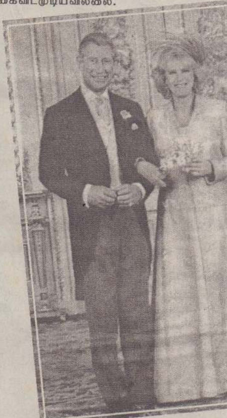
கடைசியில் இதன் காரணமாக இவ்விரு குடும்பங்கள் மத்தியிலும் ஒத்துப்போகாத நிலையில் சட்டப்படியான விவாகரத்தின் மூலம் இவ்விரு தம்பதியினரும் தத்தமது குடும்ப வாழ்வின் துன்பம் விலகிக்கொள்ள நேர்ந்தமை வரலாற்றுப் பதிவுகள்.