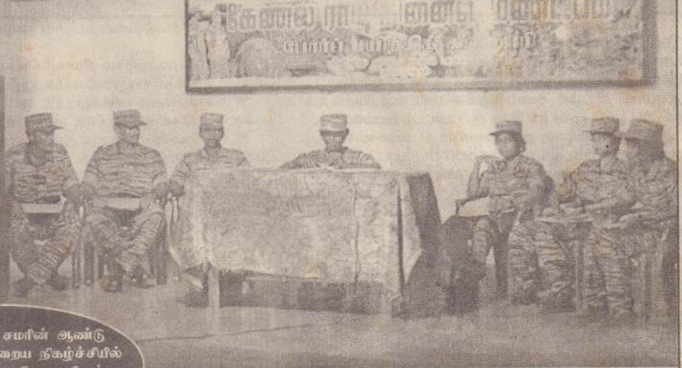
ஆணையிறவுச் சமரின் ஆண்டு விழாவின் நேற்றைய நிகழ்ச்சியில் கலந்துகொண்ட போராளிகள், பார்வையாளர்களைப் படங்களில் காணலாம்.