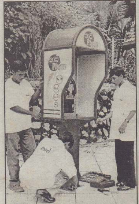
Tritel நிறுவனத்தின் தொழில்நுட்ப வியலாளர்கள் புதிய காசி தொலைபேசிக் கூண்டு ஒன்றை நிறுவுகின்றனர்.

இந்த விடயங்களைக் கருத்திற்கொண்டதன் காரணமாகவே நாம் இந்தப் புதிய நடவடிக்கையை மேற்கொண்டோம். வாடிக்கையாளர்கள் இதில் ஒரு ரூபா, இரண்டு ரூபா, ஐந்து ரூபா மற்றும் பத்து ரூபா ஆகிய நாணயக் குற்றிகளைப் பயன்படுத்தித் தொலைபேசி அழைப்புகளை மேற்கொள்ளலாம். பேசிக் கொண்டிருப்பவர் தொடர்ந்தும் பேச விரும்பினால் ஒரு ரூபா நாணயக்குற்றிகளைப் பயன்படுத்தி நேரத்தை நீடித்துக் கொண்டு போகலாம்.