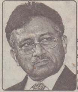
என்று பாகிஸ்தான் அதிபர் முஷாரப் போசனை கூறியுள்ளார்.