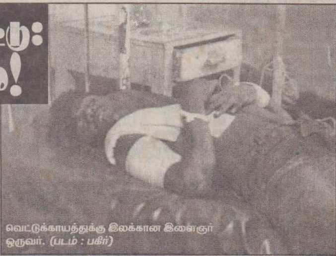
வெட்டுக்காயத்துக்கு இலக்கான இளைஞர் ஒருவர்.

இந்தத் தாக்குதலில் சைக்கிளில் பயணம் செய்தவர்கள் எனக் கூறப்படும் ஆறுபேரில் மூவர் பலத்த வெட்டுக்காயங்களுக்கு இலக்காக, ஏனையோர் தப்பிவிட்டனர் எனத் தெரி (14ஆம் பக்கம் பார்க்க)