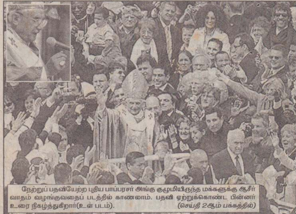
நேற்றுப் பதவியேற்ற புதிய பாப்பரசர் அங்கு குழுவியிருந்த மக்களுக்கு ஆசீர் வாதம் வழங்குவதைப் படத்தில் காணலாம். பதவி ஏற்றுக்கொண்ட பின்னர் உரை நிகழ்த்துகிறார்(உள் படம்). (செய்தி 2ஆம் பக்கத்தில்)

மேல்மாகாணசபையின் ஆளுங்கட்சி உறுப்பினர்களை ஜனாதிபதி சந்திரிகா இன்று மாலை சந்திக்கவுள்ள கழநிலையில் இந்தச் சந்திப்பும் நடைபெறுவது குறிப்பிடத்தக்கது. (எ-க)