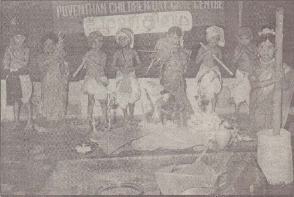
சாவகச்சேரி கண்டுவில் ஒழுங்கை புவேந்தன் பாலர் பகல் பராமரிப்பு நிலையத்தில் நடைபெற்ற உழவர் தினவிழாவில் சிறார்கள் கலந்துகொண்ட ஒரு நிகழ்ச்சியைப் படத்தில் காணலாம். (படம்: தென்மராட்சி செய்தியாளர்).