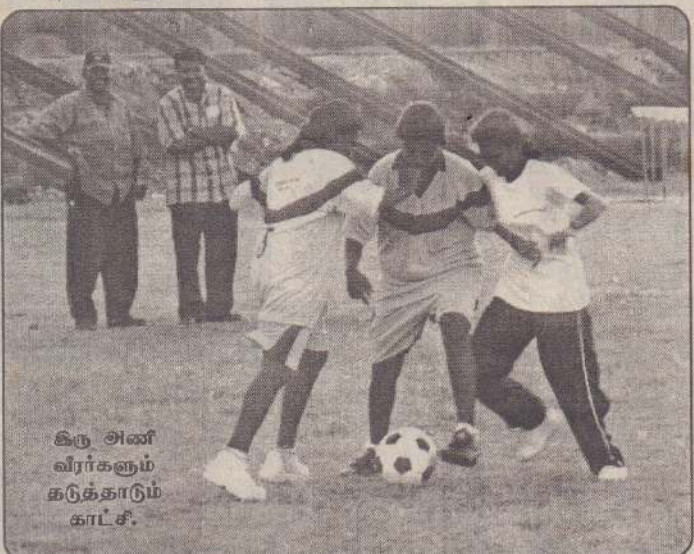
இரு அணி வீரர்களும் கடுக்காடும் காட்சி.