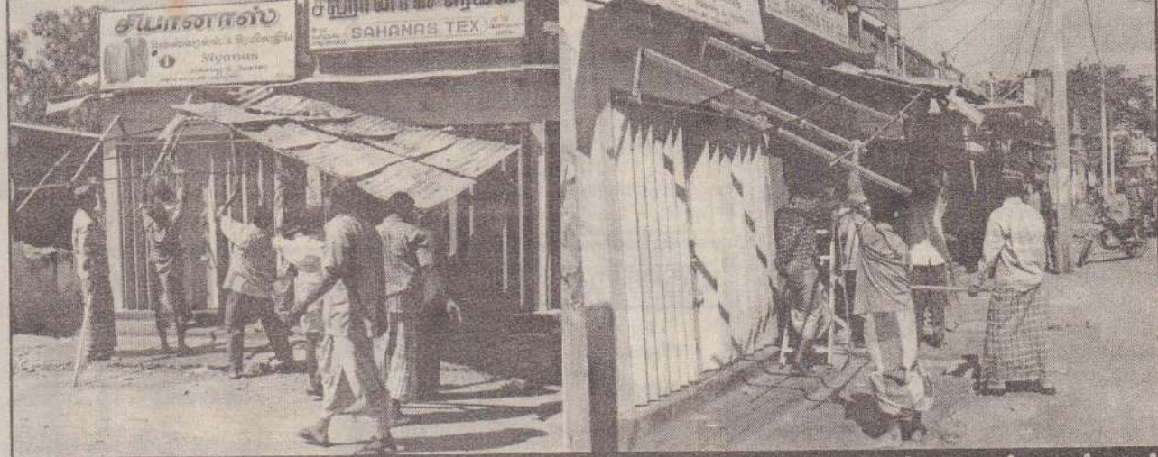
நேற்றுக்காலையொலி மின்சார நிலைய வீதியில் போக்குவரத்துக்கு இடையூறாக அமைக்கப்பட்டிருந்த தாழ்வாரக் கூரைகளை யாழ்ப்பாண மாநகரசபை ஊழியர்கள் அகற்றிய போது எடுக்கப்பட்ட படங்கள்.

யாழ்ப்பாணம், ஏப். 25 யாழ்ப்பாணம் நகரில் மின்சார நிலைய வீதியில் கடைகளுக்கு முன்பாக - வீதி ஓரத்தில் போக்குவரத்துக்கு இடையூறாக அமைக்கப்பட்டிருந்த தாழ்வாரக் கூரைகளை கடைகட்கும் பொலீஸாரின் உதவியுடன் யாழ்ப்பாண மாநகரசபையினர் நேற்று அகற்றினர். மின்சார நிலைய வீதியில் அமைந்துள்ள யாழ்ப்பாண மாநகரசபைக்குச் சொந்தமான கடைகளின் கூரைகளை அகற்றப்பட்டன. போக்குவரத்துக்கு இடையூறாக அமைக்கப்பட்டிருக்கும் கூரைகள் தொடர்பாக யாழ்ப்பாண மாநகரசபையினால் பல தடவைகள் சம்பந்தப்பட்ட கடை உரிமையாளர்களுக்கு அறிவுறுத்தப்பட்டு வந்ததாக மாநகரசபைவட்டாரங்கள் தெரிவித்தன. எனினும் இந்தத்தாழ்வாரக் கூரைகளை அகற்றுவதற்குச் சபையால் வழங்கப்பட்டிருந்த இறுதிக்காலக்கெடு முடிவடைந்து விட்ட போதிலும் கடை உரிமையாளர்கள் இவ்வியத்தில் அக்கறை காட்டவில்லை என்றும் தெரிவிக்கப்பட்டது. இதனையடுத்து நேற்றுக்காலையொலி ஸாருடன் அப்பகுதிக்கு வந்த யாழ்ப்பாண மாநகரசபை ஊழியர்கள் அங்கு அமைக்கப்பட்டிருந்த கூரைகளை அகற்றினர். அகற்றப்பட்ட கூரைகள் யாவும் பறிமுதல் செய்யப்பட்டு உழுவூ இயந்திரங்களில் ஏற்றி யாழ்ப்பாண மாநகரசபைக்கு எடுத்துச் செல்லப்பட்டன. (கு-7)