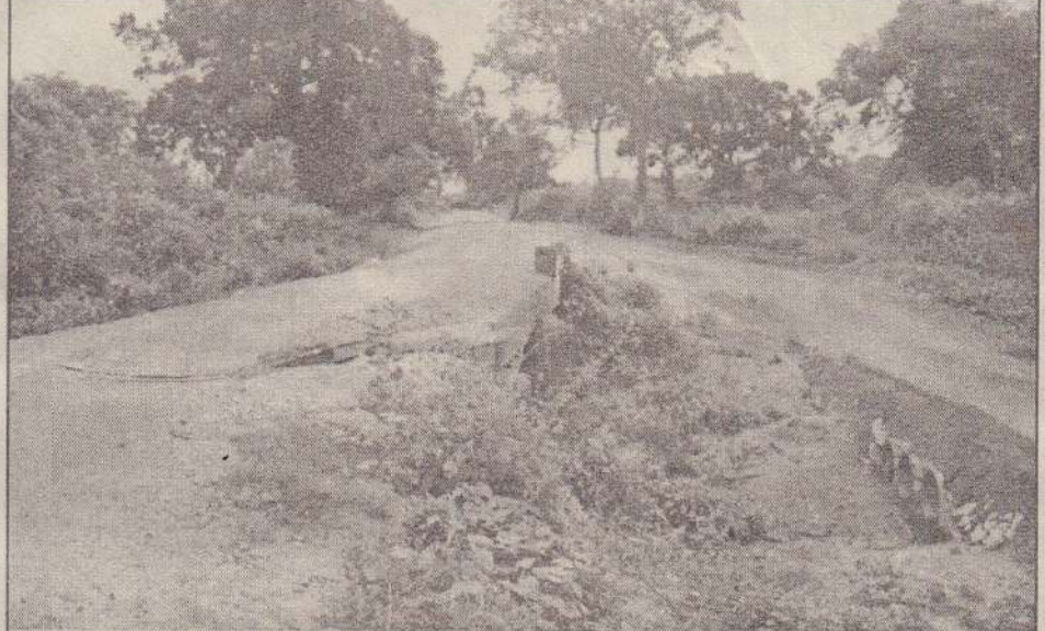
புளியங்குளம் - முல்லைத்தீவு வீதியில் சன்னாசி, பரந்தன் பகுதியிலுள்ள மதகு உடைய பாதுகாப்பற்றக் காணப்படுகின்றது. இந்தப் பாலத்திற்கு அருகில் வீதி அபிவிருத்தி அதிகார சபையால் தற்காலிக பாதையொன்று அமைக்கப்பட்டுள்ளது. அதில் பயணியது கடினமாக இருப்பதாகப் பொதுமக்கள் தெரிவித்தனர். சேதமடைந்த மதகைப் பட்டத்தில் காணலாம்.