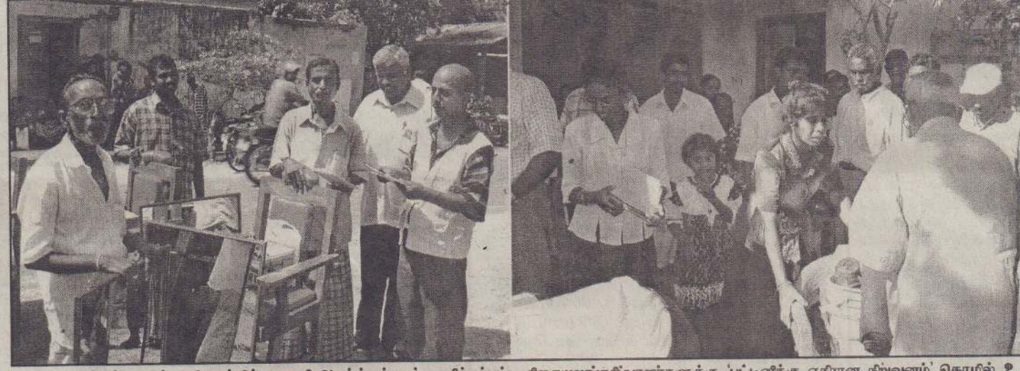
வல்லிவட்டத்துறைப் பிரதேசத்தில் சுணாமி அனாத் தந்தால் பாதிக்கப்பட்ட சிகையலங்காரியாளர்களுக்கு 'பட்டினிக்கு ஏதான நிறுவனம்' தொழில் உபகரணங்களை வழங்குவதையும், பொது மக்களுக்கு 'வேல்' விஷன் நிறுவனம் வீட்டுத் தர்பாடங்களை வழங்குவதையும் படங்களில் காணலாம். (படங்கள் : கரவெட்டிச் செய்தியாளர்)

யாழ். மாவட்டத் தமிழ்த்திணைப் போட்டி இணைப்பாளரும் யாழ். வலயக்கல்விப் பணிப்பாளருமான வே.தி.செல்வரட்னம் தெரிவித்துள்ளார். (ஓ-12)