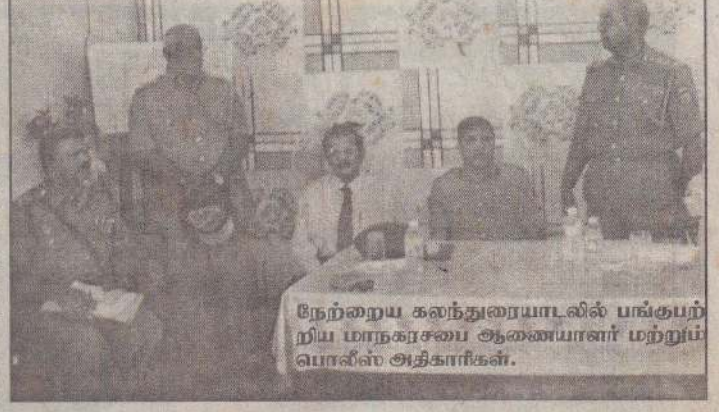
நேற்றைய கலந்துரையாடலில் பங்குபற்றிய மாநகரசபை ஆணையாளர் மற்றும் பொலீஸ் அதிகாரிகள்.

எடுக்கப்பட்டன. ★ யாழ். நகரப் பகுதியிலுள்ள ஒருவழிப் (16ஆம் பக்கம் பார்க்க)