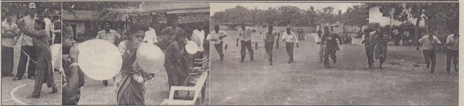
செவீப்பலன் வலுவற்றோர் புனர்வாழ்வு நிறுவனம் கொழும்பு, மட்டக்களப்பு, திருகோணமலை, வவுனியா, யாழ்ப்பாணம் ஆகிய மாவட்டங்களுக்கு கிடையேயான தடகள விளையாட்டுப் போட்டி யாழ். பல்கலைக்கழக விளையாட்டு மைதானத்தில் இடம்பெற்றது. இதில் பெண் ஒருவர் தட்டெறவதையும் 40 வயதுக்கு மேற்பட்ட ஆண்கள் பெண்களுக்கான பலூன் உடைத்தல் போட்டியில் கலந்துகொண்டவர்களையும் மற்றும் போட்டிகளில் கலந்துகொண்டவர்களையும் படங்களில் காணலாம்.