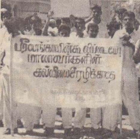
கம் ஒருபோதும் மறக்காது.