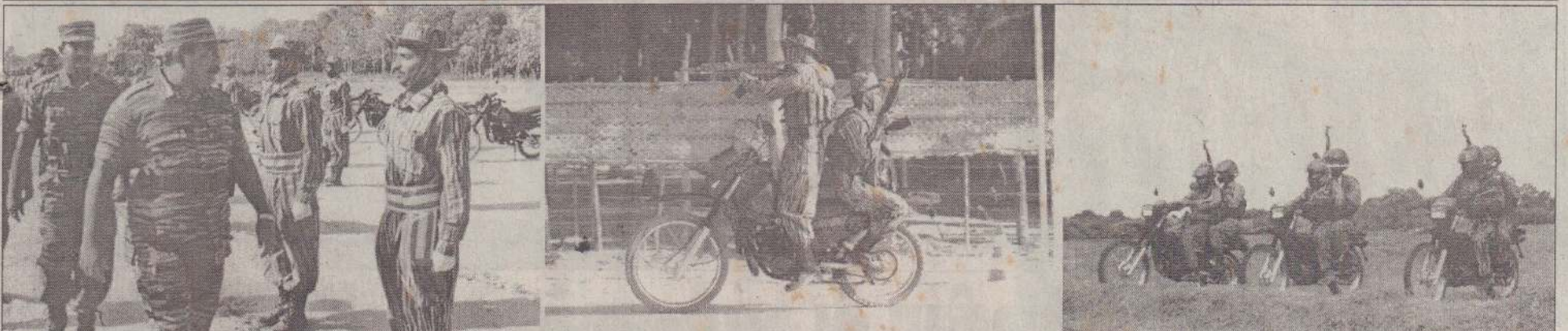
தமிழ் விடுதலைப் புலிகளின் லெட்கேனல் கிம்ரான் பாண்டியன் படையணியின் அதிவேக மோட்டார் சைக்கிள் படைப் பிரிவின் முன்றாவது அணி பயிற்சியை நிறைவு செய்துள்ளது. சிதற்கான நிகழ்வில் தலைவர் பிரபாகரன் பங்கேற்றார். அப்போது அவர் கிராணுவ மரியாதையை ஏற்றுக்கொள்வதை முதலாவது படத்திலும் தாக்குதல் ஒத்திக்கொண்ட அடுத்துள்ள படங்களிலும் காணலாம்.

சுடர் 20 வள்ளுவர் ஆண்டு 2036 ஆனி 20 திங்கட்கிழமை (04.07.2005) UTHAYAN-A Lively National Tamil Daily கதிர் :220