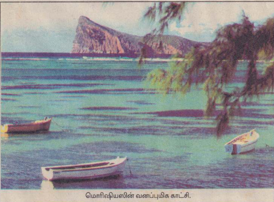
மொரிஷியஸின் வனப்புமிக காட்சி.

கொழும்பில் இருந்து எமிரேட்ஸ் விமானத்தில் மூன்று பொழுதுபோக்கு இடங்களுக்குப் பயணமாவோர் கோடை விசேட நன்மைகளைப் பெறுவர் என அவ்விமான சேவை அறிவித்துள்ளது.