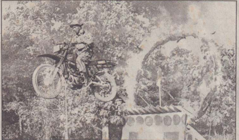
தமிழ் விடுதலைப் புலிகளின் வெடிகேண்டி மீறான் பாண்டியன் படையணியின் அதிவேக மோட்டார் சைக்கிள் பண்புப் பீரின்மீள் முன்றாவது அணி பயிற்சியை நிறைவு செய்துள்ளது. இதற்கான நகம்வில் போராளி ஒருவர் நடத்திக்கூட்டிய சாகசம் இது.

நாளை கோட்டீதியாக இடம்பெறவுள்ள கரும்புலிகள் தின நிகழ்வுகளில் தமிழ் மக்கள் உணர்வு மூச்சு சிவியுடன் கலந்துகொண்டு தேசிய விடுதலைப் போராட்டத்தில் உன்னத போராயுதங்களான கரும்புலிகளை நினைவுகூர வேண்டுகிறோம் என்று யாழ்.மாவுட்ட தேசிய எழுச்சிப் பேரவை அழைப்பு விடுத்ததுள்ளது. (ஓ-17-70-173-204)