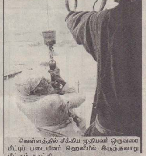
வெள்ளத்தில் சிக்கிய முதியவர் ஒருவரை மீட்புப் படையினர் ஹெலியில் கிடுங்கவாறு மீட்கும் காட்சி

இந்த மழை - வெள்ளம் காரணமாக குஜராத் மாநிலத்தில் சுமார் 1 கோடிபேர் பாதிக்கப்பட்டுள்ளனர் என மதிப்பிடப்பட்டுள்ளது. இதேவேளை, வெள்ளம் சூழ்ந்த மாவட்டங்களில் ரயில், சாலைப் போக்குவரத்துகள் மோசமாகப் பாதிக்கப்பட்டுள்ளன. குறிப்பாக அஹமதாபாத் - மும்பை இடையே ரயில் பாதையில் வெள்ளம் சூழ்ந்ததால் ஆங்காங்கே நடு வழியில் ரயில்கள் நிறுத்தி வைக்கப்பட்டன. சாந்தி எக்ஸ்பிரஸ் உட்பட 3 ரயில்களில் சிக்கித் தவித்த ஏறத்தாழ 3500 ரயில் பயணிகள் மீட்கப்பட்டுள்ளனர்.