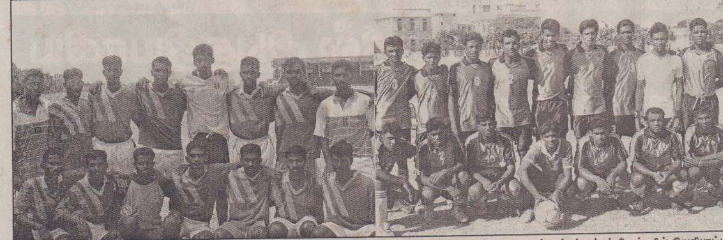
வடக்கு - கிழக்கு மாகாண விளையாட்டுத் திணைக்களத்தின் ஏற்பாட்டில் கிடம்பிறும் மாகாண மட்ட உதைந்தாட்டச் சுற்றுப் போட்டியின் கிறியாட்டம் இன்று மாலை 4 மணியளவில் யாழ்ப்பாணம் பொது விளையாட்டு மைதானத்தில் கிடம்பெறவுள்ளது. இதில் மோதலுள்ள யாழ்ப்பாணம் அணியையும் (கி.டா) மன்னார் மாவட்ட அணியையும் படங்களில் காணலாம். கிப்போட்டியில் முன்றாம் கிடத்திற்கான ஆட்டம் காலை 8.30 மணியளவில் கிடம்பெறவுள்ளது. இதில் திருகோணமலை மாவட்ட அணியை எதிர்த்து மட்டக்களப்பு மாவட்ட அணி மோதலுள்ளது.

வட்டக்கச்சி, ஜூலை 4 களிநொச்சி மாவட்ட மாணவர்களிடையே நடத்தப்படும் தமிழ்மொழிக் கலைத்திறன் போட்டிகள் இன்று திங்கட்கிழமையும் நாளை மறுதினம் புதன்கிழமையும் காலை 9 மணி தொடக்கம் நடைபெறவுள்ளன. இந்தப் போட்டிகளில் இன்று திங்கட்கிழமை களிநொச்சி மத்திய கல்லூரியில் மொழித்திறன் போட்டிகளும் - நாளைமறுதினம் புதன்கிழமை களிநொச்சி மத்திய கல்லூரியில் இசை, நடன வில்லிசைப் போட்டிகளும் - களிநொச்சி மகா வித்தியாலயத்தில் நாடகம், நாட்டுக்கூத்துப் போட்டிகளும் நடைபெறும் எனத் தெரிவிக்கப்பட்டது. (கு-405-204)