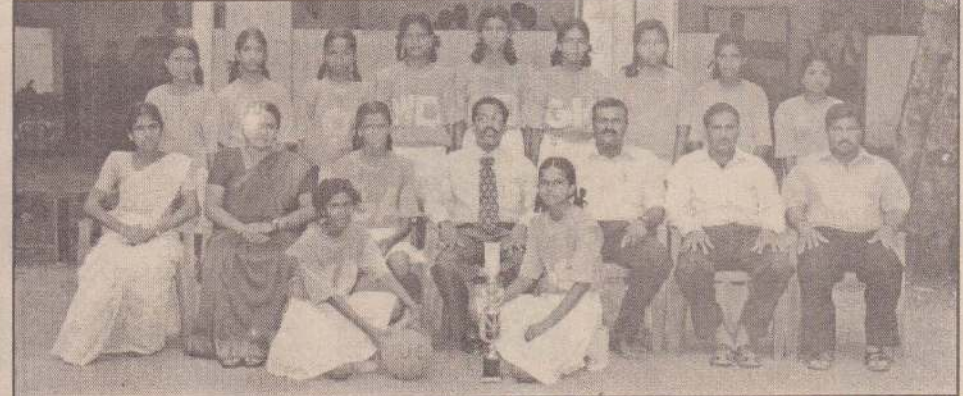
15 வயதுக்குட்பட்டோர் அணி

இதில், தெல்லிப்பழை யூனியன் கல்வூரி 15 வயதுக்குட்பட்டோர் பிரிவிலும், 19 வயதுக்குட்பட்டோர் பிரிவிலும் முதலிடத்தைப் பெற்றது. 17 வயதுக்குட்பட்டோர் பிரிவில் இரண்டாம் இடத்தைப் பெற்றது. இதனால், தேசியமட்டப் போட்டியில் பங்குபற்றும் தகுதியை இக்கல்வூரியின் மூன்று பிரிவு அணிகளும் பெறுகின்றன. (ஒ-86-164)