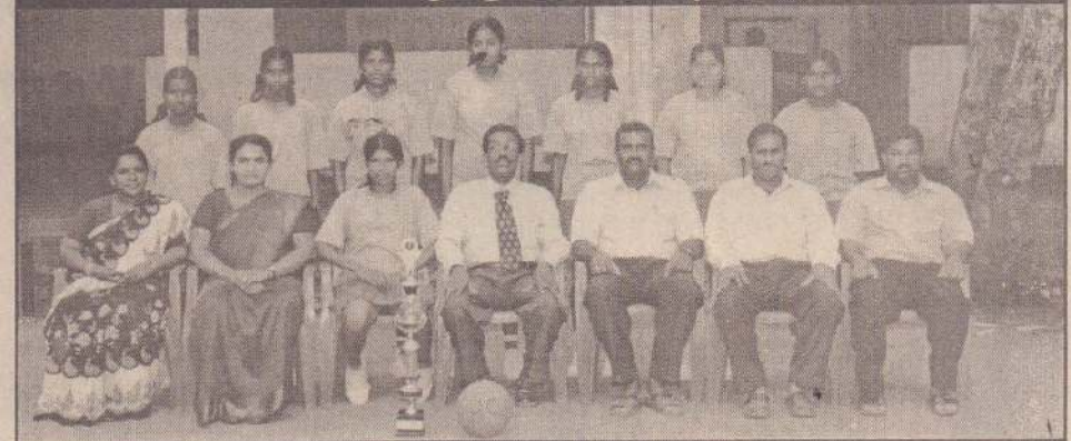
19 வயதுக்குட்பட்டோர் அணி

தேசிய மட்டப் போட்டிக்குத் தகுதி பெற்றுள்ள தெல்லிப்பழை யூனியன் கல்வூரியின் வலைபந்தாட்ட அணி வீரர்களைக் கண்டி, அணிப் பொறுப்பாசிரியர்கள் மற்றும் அதிபருடன்....