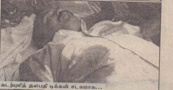
கடற்புலித் தளபதி டிக்கன் சடலமாக...

அலுவலகத்திற்குள் நுழைந்து அவர்கள் கண்மூடித்தனமாகத் துப்பாக்கிப்பிரயோகம் செய்தனர். கிரனேட் தாக்குதலையும் நடத்தினர். இதில் அங்கிருந்த போராளிகள் இருவர் உட்பட ஐவரும் இரத்த வெள்ளத்தில் சரிந்தனர். அவர்களில் நால்வர் அந்த இடத்திலேயே உயிரிழந்தனர். அதன் பின்னர் தாக்குதல் நடத்தியவர்கள் மீண்டும் வானில் ஏறித் தப்பிச் சென்றுவிட்டனர்.