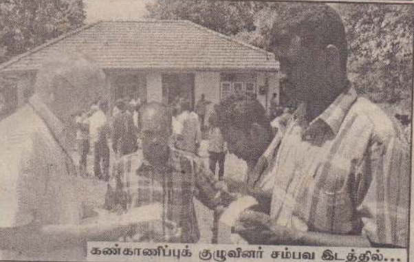
கண்காணிப்புக் குழுவின் சம்பவ கிடத்தல்...

அலுவலகத்திற்குள் நுழைந்து அவர்கள் கண்மூடித்தனமாகத் துப்பாக்கிப்பிரயோகம் செய்தனர். கிரனேட் தாக்குதலையும் நடத்தினர். இதில் அங்கிருந்த போராளிகள் இருவர் உட்பட ஐவரும் இரத்த வெள்ளத்தில் சரிந்தனர். அவர்களில் நால்வர் அந்த இடத்திலேயே உயிரிழந்தனர். அதன் பின்னர் தாக்குதல் நடத்தியவர்கள் மீண்டும் வானில் ஏறித் தப்பிச் சென்றுவிட்டனர்.