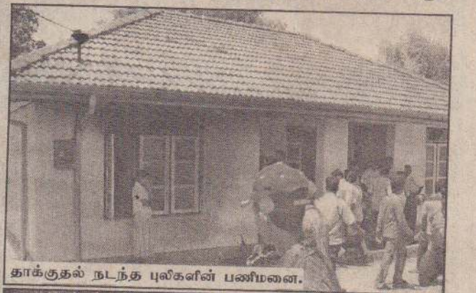
தாக்குதல் நடந்த புலிகளின் பணிமனை.

திருகோணமலை மூன்றாம் கட்டைச் சந்தியில் இருந்து செல்வநாயகபுரம் நோக்கிச் செல்லும் வீதியில் செல்வநாயக புரத்தில் இருக்கும் அரசு பண்ணை வீட்டில் அமைந்திருந்த புலிகளின் அலுவலகமே தாக்கப்பட்டது. வேகமாக வந்துநின்ற வெளிர் சாம்பல்நிற வான் ஒன்றிலிருந்து குதித்த 10 முதல் 15 பேர் வரையானோர் ஆயுதங்களுடன் புலிகள் தங்கியிருந்த வீட்டை நோக்கிப் பாம்புந்தனர் என்றும்- அப்போது அவர்கள் 'சுடா சுடா' என்று தமிழில் கத்தினர் என்றும் சம்பவத்தை நேரில் கண்ட சாட்சிகள் தெரிவித்தனர். ஆயுததாரிகள் அனைவரும் கறுப்பு உடைகளை அணிந்திருந்தனர் என்றும், தமது முகங்களைக் கறுப்புத்துணியால் மூடிக் கட்டியிருந்தனர் என்றும் தெரிவிக்கப்பட்டது.