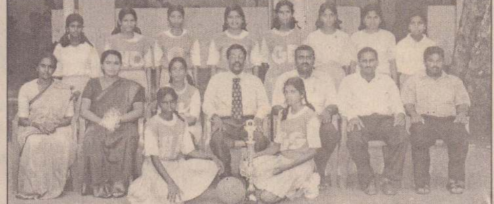
17 வயதுக்குட்பட்டோர் அணி