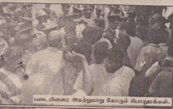
படையினரை அகற்றியுற கோரும் பொதுமக்கள்.

இடத்திலேயே உயிரிழந்தனர். மேலும் ஒருவர் காயமடைந்தார். அரசு கட்டுப்பாட்டுப் பகுதிக்குள் இருந்த புலிகளின் அலுவலகம் மீதே தாக்குதல் நடத்தப்பட்டுள்ளது. இராணுவத்தினரே இந்தத் தாக்குதலை நடத்தினர் என்று புலிகள் குற்றஞ்சாட்டினர். படைத்தரப்பு அதனை மறுத்தது. சம்பவத்தையடுத்து திருகோணமலை நகரத்தில் பெரும் பதற்றம் ஏற்பட்டுள்ளது. பாதுகாப்புத் தீவிரப்படுத்தப்பட்டுள்ளது.