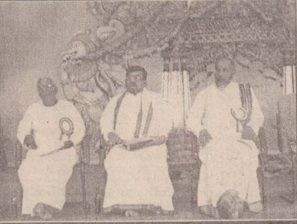
அகில இலங்கை இந்துமாமன்றம் யாழ். தேசியக் கல்வியியற் கல்லூரியும் இணைந்து இலங்கையில் இந்து சமயம் என்ற தொனிப்பொருளில் நடத்திய மாநாட்டின் நிறைவு நிகழ்வுகள் நேற்று இடம்பெற்றன. இதில் கலந்துகொண்ட பிரமுகர்கள் மற்றும் பொதுமக்களில் ஒரு பகுதியினரையும் சிறப்புச் செயலமர்வில் பங்கேற்ற ஒய்வுபெற்ற நீதியரசர் சி.வி.விக்னேஸ்வரன், யாழ்.மாவட்ட நீதிபதி இ.த.விக்னராஜா, போராளியர் அ.சண்முகதாஸ் ஆகியோரையும் படங்களில் காணலாம்.