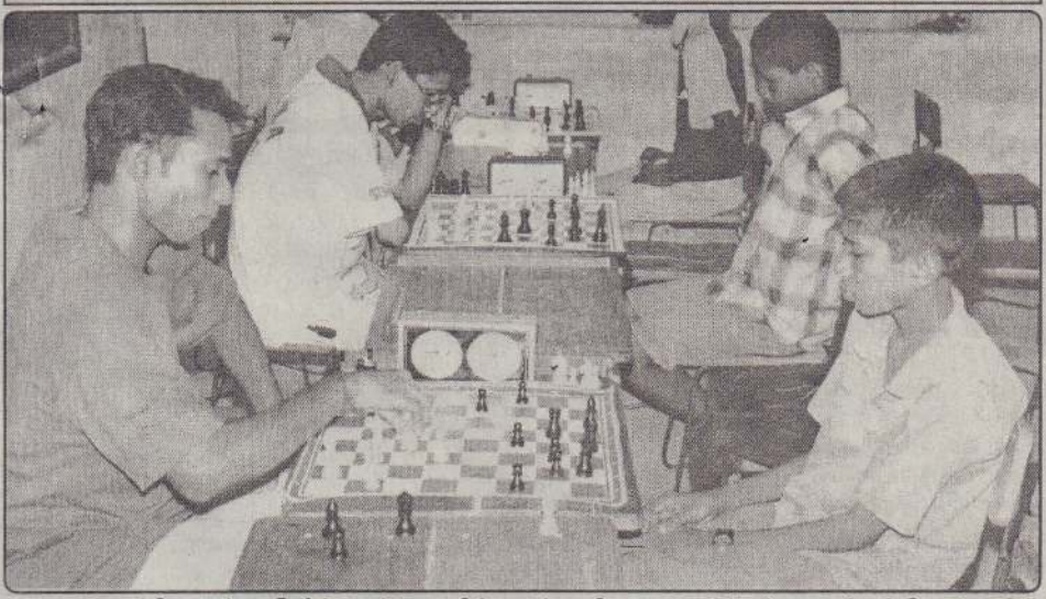
யாழ். மத்திய கல்லூரியில் அண்மையில் நடந்த விரைவு நகர்த்தல் சதுரங்கப் போட்டியில் கலந்துகொண்டவர்களின் போட்டியின் ஒரு கட்டத்தைப் படத்தில் காணலாம். (3)