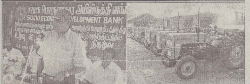
தமிழர் புனர்வாழ்வுக்கழக சமூக பொருளாதார அபிவிருத்தி வங்கியின் டிராக்டர் வழங்கும் நிகழ்வில் சமூக, பொருளாதார அபிவிருத்தி வங்கியின் பணிப்பாளர் உரையாற்றுவதையும் அரச சார்பற்ற நிறுவனங்களுக்கு வழங்கப்பட்ட உழவு டிராக்டர்களுக்கும் படங்களில் காணலாம்.