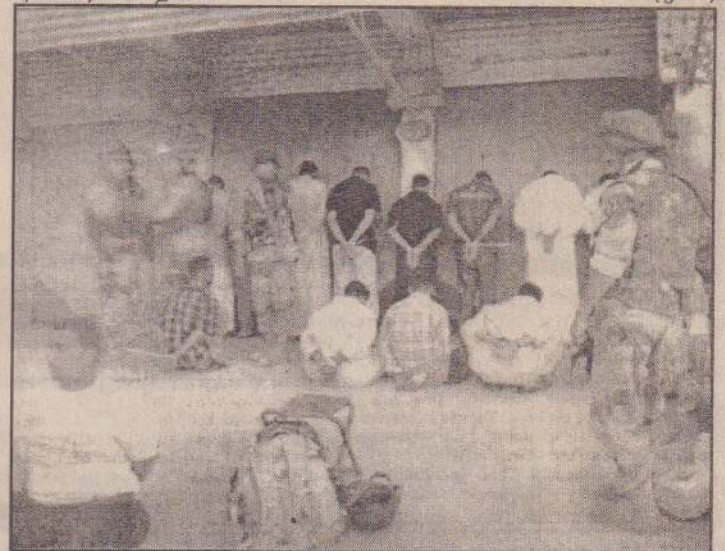
ஈராக்கிய இராணுவத்தினரும், அமெரிக்கப் படையினரும் இணைந்து அல்-சுருக் (சூரிய உதயம்) என்ற பெயரில் கிளர்ச்சியாளரைத் தேடும் நடவடிக்கையை மேற்கொண்டுள்ளனர். இதன்போது சந்தேகத்தின்பேரில் கைதானவர்களிடம் சோதனை நடத்தப்படுவதைப் படத்தில் காணலாம்.