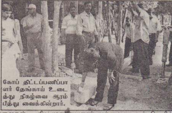
கோப் திட்டப்பணிப்பாளர் தேங்காய் உடைத்து நிகழ்வை ஆரம்பித்து வைக்கிறார்.

பின்னர் வேலைகள் அனைத்தும் பூர்த்தியடைந்ததும் மேலும் 2 ஆயிரத்து 500 பேருக்கு இணைப்பு வழங்கப்படும். தொலைபேசி இணைப்புகளைப் பொருத்தும் கேபிள் களுக்கு மட்டும் 250 மில்லியன் ரூபா ஒதுக்கப்பட்டுள்ளது. ஏனைய தேவைகளுக்கான நிதி இதற்குப் பூர்த்தியாக ஒதுக்கப்பட்டுள்ளது.