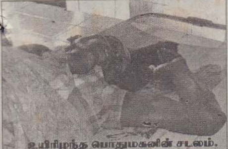
உயிரிழந்த பொதுமக்களின் சடலம்.

மட்டக்களப்பு, மே10 மட்டக்களப்பு, சந்திவெளியில் எதிர்ப்பு ஆர்ப்பாட்டம் மற்றும் மறியலில் ஈடுபட்ட பொதுமக்கள் மீது இராணுவத்தினர் துப்பாக்கிச் சூடு நடத்தினர். இதில் பொதுமக்கள் ஒருவர் கொல்லப்பட்டார்; 25 பேருக்கு மேல் காயமடைந்தனர். மேலும் பலருக்குச் சிறுகாயங்கள் ஏற்பட்டுள்ளன.