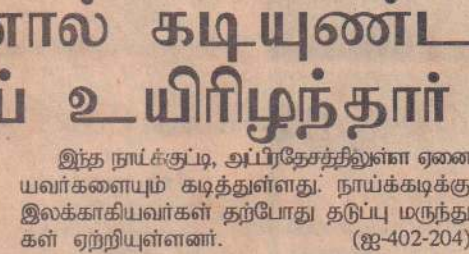
இந்த நாட்க்குட்பு, அப்பிரதேசத்திலுள்ள ஏனை யவர்களையும் கடித்துள்ளது. நாய்க்கடிக்கு இலக்காகியவர்கள் தற்போது தடுப்பு மருந்துகள் ஏற்றியுள்ளனர். (ஐ-402-204)

விசுவமடு, டிசெ.23 வளர்ப்பு நாய்க்குட்டியினால் கடியுண்ட கர்ப்பிணித் தாய் ஒருவர் உரிய கவனம் எடுத்து சிகிச்சை பெறாத காரணத்தினால் உயிரிழந்தார். கடந்த சில வாரங்களுக்கு முன்பு விசுவமடு 'ரெட்பாண்ட்' பகுதியில் இச்சம்பவம் இடம்பெற்றது. உடல் உபாதைக்குள்ளாகிய மேற்படி பெண், புதுக்குடியிருப்பு மருத்துவமனையில் அனுமதிக்கப்பட்டு, மேலதிக சிகிச்சைகளுக்காக யாழ்ப்பாணம் போதனை வைத்தியசாலைக்கு அனுப்பிவைக்கப்பட்டார். அங்கு அவர் பிரசவித்த குழந்தையைக் காப்பாற்ற முடிந்தது. ஆனால், தாயர் உயிரிழந்ததாகத் தெரிவிக்கப்பட்டது.