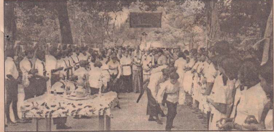
வட்டக்கச்சி பிரதேச மாவீரர்களின் பெற்றோர் கௌரவிப்பு நிகழ்வு கிராமநாதபுரம் ம.வியில் கடந்த மாதம் நடைபெற்றது. இந்நிகழ்வில் பாடசாலை மாணவர்கள் அணிவகுத்து நின்று மாவீரர் பெற்றோர்களுக்கு மலர் மாலை அணிவித்து கலைநிகழ்வுகளுடன் அவர்களை மண்டபத்துக்கு அழைத்துச் செல்வதைப் படத்தில் காணலாம்.

குளத்தின் புனரமைப்பு வேலைகள் நிராகரிக்கப்பட்டமை குறித்து விவசாயிகள் விசமம் தெரிவிக்கின்றனர். இவ்விடயம் குறித்து அரச அதிபர், உதவி அரச அதிபர் ஆகியோருக்கு மகஜர்கள் அனுப்பி வைத்துள்ளனர். இக்குளம், 12 அடி நீர் கொள்ளக் கூடியது. தற்போது தூர்ந்துள்ள நிலையில் 9 அடி நீர் மட்டமே கொள்ளக்கூடியதாகவுள்ளது. மழையினால் இக்குளக்கட்டில் பாரிய உடைப்பு ஒன்று ஏற்பட்ட போதிலும் விவசாயிகள் ஆதனை மண்மூடைகள் போட்டு தற்காலிகமாகத் தடுத்துள்ளனர். இக்குளத்தினைப் புனரமைப்புச் செய்யாவிடில், குளத்து நீரை நம்பி இருக்கும் விவசாயிகள் பெரிதும் பாதிக்கப்படுவார்கள் என்று கூட்டிக்காட்டப்படுகிறது. இதனால், 'நியாப்' திட்டத்தின் கீழ் இக்குளத்தினைப் புனரமைத்து விவசாயத்துக்கு உதவ வேண்டுமென விவசாயிகள் கோரிக்கை விடுத்துள்ளனர். (ஐ-341-204)