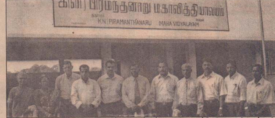
கிளிநொச்சி பிரமந்தனாறு மகாவித்தியாலயத்தின் 15ஆவது ஆண்டு நிறைவு விழாவும் புதிய கட்டடத் திறப்பு விழாவும் கடந்த மாதம் நடைபெற்றன. இந்நிகழ்வில் அத்தகனாகக் கலந்து கொண்டவர்களைப் படத்தில் காணலாம்.