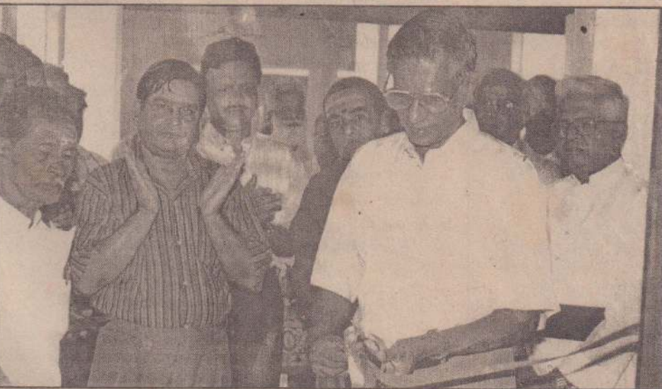
பண்டத்தரிப்பு அரசினர் கிராமிய வைத்தியசாலையில் புத்தாக நிர்மாணிக்கப்பட்ட மகப்பேற்று நிலையத்தின் திறப்புவிழா அண்மையில் இடம்பெற்றது.

எஸ்.பி.யை போகும்பரை சிறைச்சாலைக்கு மாற்றப்போவதாக வெளிவந்திருக்கும் தகவல்கள் குறித்து ஆராயுமாறும் எதிர்க்கட்சித் தலைவர் பணிப்புரை விடுத்தள்ளார் எனத் தெரிவிக்கப்பட்டது. (எ-க-4)