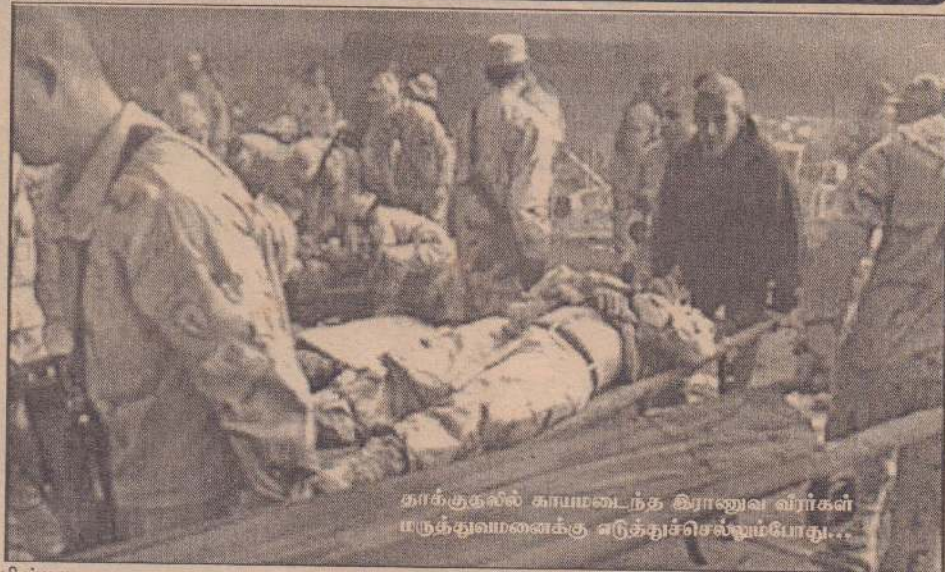
தாக்குதலில் காயமடைந்த இராணுவ வீரர்கள் மருத்துவமனைக்கு எடுத்துச்செல்லப்போது...

சுனி முஸ்லிம்களின் சார்பில் இயங்கும் தீவிரவாத அமைப்பொன்றே இத்தாக்குதலை மேற்கொண்டிருக்கலாம் எனச் சந்திக்கப்படுகிறது.