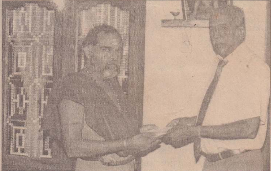
விபத்தில் உயிரிழந்த ஒருவருக்கான ஆயுள் காப்புறுதித் தொகை அண்மையில் இலங்கை ஆயுள் காப்பீட்டுக் கூட்டுத்தாபனத்தினால் வழங்கப்பட்டது.