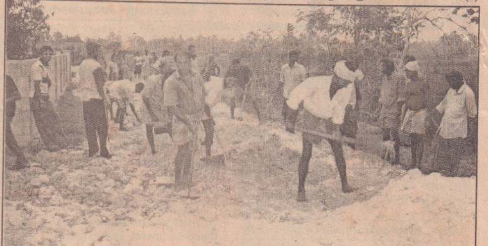
கைதடி மத்தியிலுள்ள முர்த்தியாவத்தை விவசாய வீதி, சமுர்த்தி அதிகாரசபையின் நிதியுதவியுடனும், அப்பகுதி மக்களின் பங்களிப்புகளும் அண்மையில் புனரமைக்கப்பட்டது. இந்த வீதியை சீர்தரமான முறையில் புனரமைக்கும் பணியில் கைதடி மத்தி வளர்மதி சனசபை முயற்சி செய்துள்ளது.

நீடித்துக்கொள்வதில் தான் முனைப்பாக நிற்கின்றார். உரிய நேரத்தில் நடத்தவேண்டிய தேர்தல்களை நடத்தாவிட்டால் ஐ.தே.கவும் மாற்று நடவடிக்கைகளை மேற்கொள்வதைத் தவிர்க்க முடியாது என்று திஸ்ஸ அத்தநாயக்க கூறினார். (எ.க)