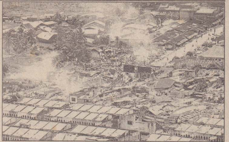
சுமாத் திராவில் கடந்த திங்களன்று ஏற்பட்ட பூகம்பத்தில் சிந்தோனேசியாவில் உள்ள 'குனாங் சிட் டோல்' நகரில் பெரும்பாலான கட்டிடங்கள் கிடைந்து சேதமடைந்தன. அந்தக் காட்சியையே படத்தில் காண்கிறீர்கள். (8)

மீண்டும் மீண்டும் ஏற்படும் நில அதிர்வுகள் காரணமாகச் சுமாத் திராத் தீவின் அருகிலுள்ள பகுதிகளில் வாழும் மக்கள் பெரும் பீதியுடன் உள்ளனர் என்று செய்தியாளர்கள் தெரிவிக்கின்றனர். (8)