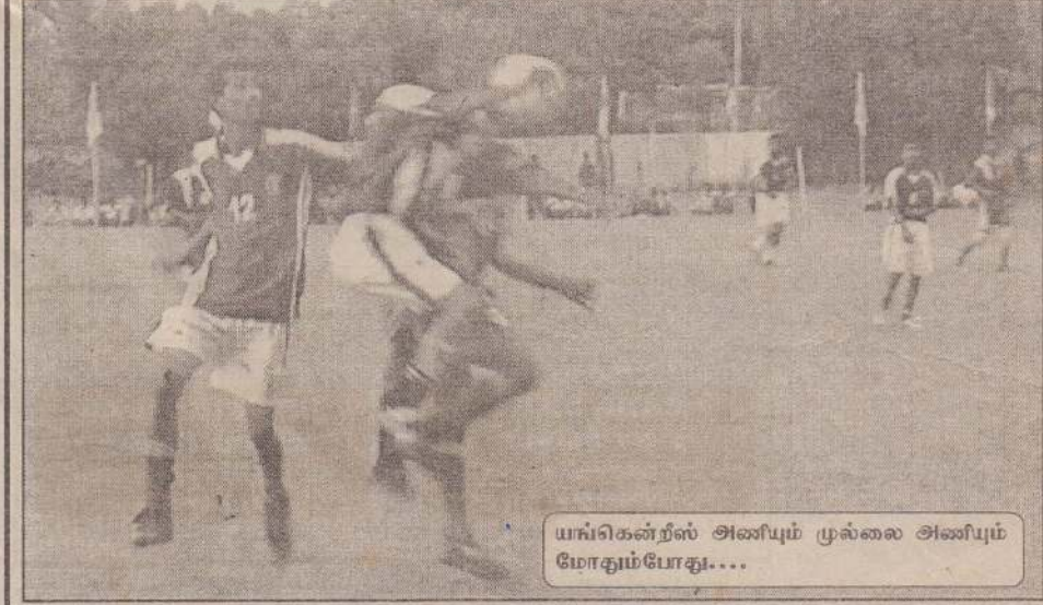
யங்கென்றீஸ் அணியும் முல்லை அணியும் போதும் போது...

ளர் வெளியால் சென்ற பந்தை உள்ளே எடுத்துக் கொடுத்தபோதும் அதனை மீண்டும் வெளியால் எறிந்தார் என்ற குற்றச்சாட்டில் மத்தியஸ்தரினால் மஞ்சள் அட்டை காட்டி எச்சரிக்கப்பட்டார். மூலை உதையெனக் கருதி வெளியால்