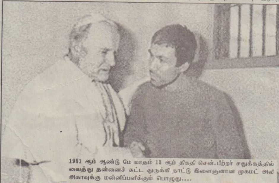
1981 ஆம் ஆண்டு மே மாதம் 13 ஆம் திகதி சென்.பீற்றர் சதுக்கத்தில் வைத்து தன்னைச் சுட்ட முகமட் நாட்டு கிளைஞனான முகமட் அலி அகாவுக்கு மன்னிப்பளிக்கும் பொழுது....

மக்களோடு தன்னை அடையாளப்படுத்தி அவர்களிடையே நல்ல நண்பனாகப் பழகுவதைத் திருத்தந்தை பெரிதும் விரும்பினார். குழந்தைகள்மீதும் அதிகம் பிரியம் கொண்டவர். அவர்களை அரவணைத்து அன்போடு பழகினார். இளைஞர்கள் நாளைய தலைவர்கள்