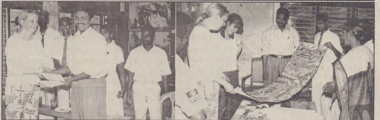
சர்வதேச மக்களுக்கான மக்கள் (PIPI) என்ற நிறுவனம் நாடுகளுக்கிடையில் நல்லுறவை வளர்க்கும் நோக்கில் சுவர் ஓவியக் கண்காட்சி ஒன்றை நடத்துகின்றது. இக்கண்காட்சியில் காட்சிப்படுத்துவதற்காக க.ஏ.ரி. சித்திரப்பயிற்சி நிறுவனமும் தமது மாணவர்களின் படைப்புக்களையும் அனுப்பி வைத்துள்ளது.

அதை எதிர்கொள்ளத் தயார் என்றால் சிங்களம் தனது இந்தப் போக்கில் தொடரட்டும். இப்போதைய விளையின் விளைவை அறுவடை செய்ய நேரிடும்.