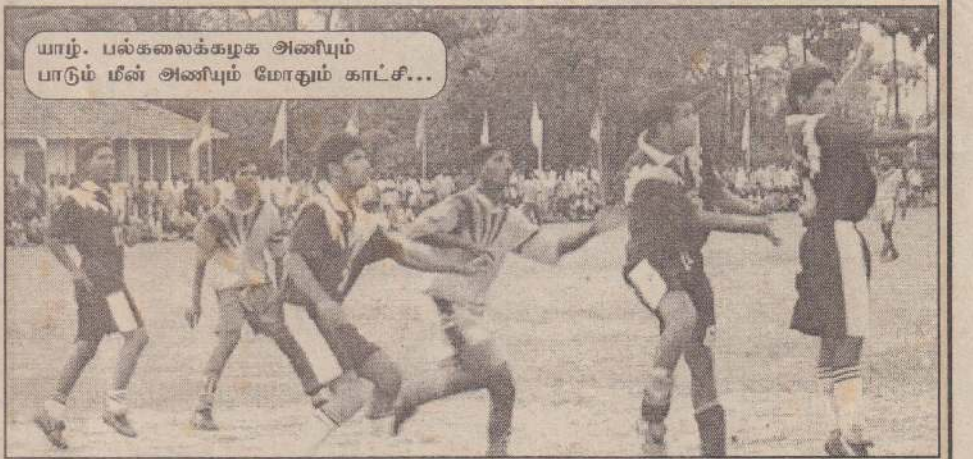
யாழ். பல்கலைக்கழக அணியும் பாடும்மீன் அணியும் போதும் காட்சி...

பெறாத நிலையில் ஆட்டம் முடிவடைந்தது. இரண்டாவது பாதி ஆட்டத்தில் பல்கலைக்கழக அணியினர் பாடும்மீன் விளையாட்டுக் கழகத்தினர் கோல் கம்பத்தை ஆக்கிரமித்து முன்னேறி விளையாடினார்கள். இரு அணிகளுக்கும் கோல்கள் பெறும் வாய்ப்புகள் சில கிடைக்கப் பெற்றபோதிலும் இரு அணிகளுமே கோல்களைப் பெற முடியவில்லை. பந்துகள் கோல்கம்பங்களுக்கு வெளியால் அடிக்கப்பட்டமையால் கோல்கள் பெற முடியவில்லை. ஆட்டம் முடிவடைவதற்கு சில நிமிடங்கள் இருக்கையில் பல்கலைக்கழக கோல் காப்பா