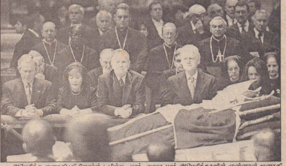
அமெரிக்க ஜனாதிபதி ஜோர்ஜ் டபிள்யூ. புஷ், லாரா புஷ் அமெரிக்காவின் முன்னாள் ஜனாதிபதிகளான பில் கிளிண்டர், எச்.டி.டி.பி.யு. புஷ், வெளிவிவகார அமைச்சர் கொண்டோலிசா ரைஸ் ஆகியோர் பாப்பரசருக்கு அஞ்சல் செலுத்தும் காட்சி.

மறைந்த பாப்பரசர் இரண்டாவது அருளப்பர் சின்னப்பர் விமர்சித்தார்; எதிர்க்கு குரலெழுப்பியிருந்தார். இதனைத் தொடர்ந்து அமெரிக்க - வத்திக்கான் உறவுகளில் விரிசல் ஏற்பட்டது. பின்னர், ஜனாதிபதி புஷ் வத்திக்கான் சென்று பாப்பரசரை சந்தித்து மீளவும் இரு நாட்டு உறவுகளிலும் வலுசேர்த்தார் என்பதும் குறிப்பிடத்தக்கது. அதன் பின்னர் அமெரிக்க நிர்வாகத்தின் உயர் பிரதிநிதிகளின் மேற்படி வத்திக்கான் வருகை பெரும் எதிர்வுகூட்டப்பட்ட விடயமாக இருந்தது. இதேவேளை, பாப்பரசரின் முதலடவலுக்கு இறுதி அஞ்சல் செலுத்தவரும் மக்களின் தொகை அதிகரித்துள்ளது. இதனால், வத்திக்கான் சன நெருக்கத்தைக் கட்டுப்படுத்த முடியாமல் திணறுகிறது. பாதுகாப்பு நடவடிக்கைகள் பலப்படுத்தப்பட்டு, ஆகாயத்தில் பாதுகாப்பு விமானங்கள் பறக்க விடப்பட்டுள்ளன. (ஐ-க)