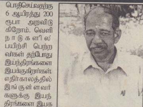
பொதிசெய்வதற்கு 6 ஆயிரத்து 200 ரூபா அறவிடுகிறோம். வெளிநாடுகளில் பயிற்சி பெற்றவர்கள் தற்போது இயந்திரங்களை இயக்குகிறார்கள். எதிர்காலத்தில் இங்குள்ளவர்களுக்கு இயந்திரங்களை இயக்க பயிற்சி வழங்கவுள்ளோம். எதிர்காலத்தில் இயந்திரத்துக்கு அறவிடும் கட்டணம் குறைய வாய்ப்புள்ளது.

தற்போது இந்த இயந்திரங்கள் தலா 12 லட்சத்து 50 ஆயிரம் ரூபாவுக்கு இறக்குமதி செய்யப்பட்டுள்ளன. ஓர் ஏக்கர் வயலில் நெல்லை அறுவடை செய்து தனியாக்கிப்