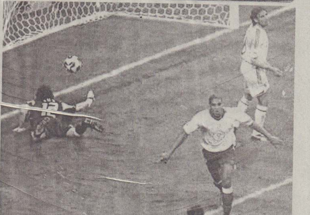
ஜேர்மனியில் நடந்த கான்படரேசன் உதைபந்தாட்ட போட்டியின் இறுதி ஆட்டத்தில் ஆர்ஜன் உனாவை பிரேரேஸ் 4 : 1 என்ற கோல் கணக்கில் வென்று சம்பியனானது. ஆட்டத்தின் ஒரு கட்டத்தைப் படத்தில் காணலாம்.

ஸ்ரீ மகாவிஷ்ணு வி.க. எதிர் ஸ்ரீ தாஸ் வி.க. வளர்மதி வி.க. எதிர் ஞானதீபம் வி.க.