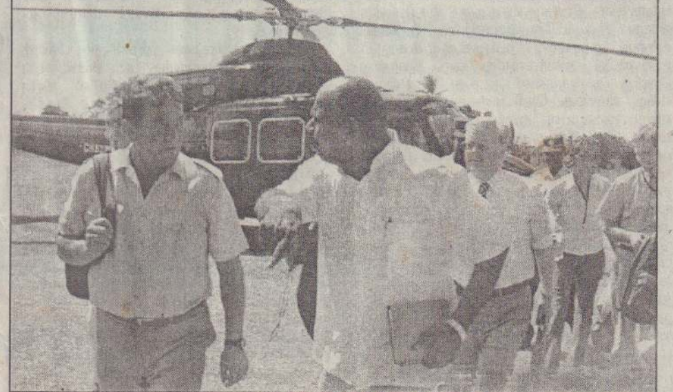
கிளிநொச்சிக்கு நேற்று விஜயம் செய்த நோர்வேத் தரப்புப் பிரதிநிதிகளை விடுதலைப் புலிகளின் சமாதானச் செயலகப் பணியாளர் புலித்தலைவர் வரவேற்று, உழைத்துச் செல்வதைப் பூ.ததில் காணலாம்.