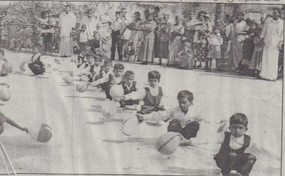
கூ.வில், கிரிமலை சிவானந்தா முன்பள்ளி வருடாந்த விளையாட்டு விழா, பன்னாசலையில் உள்ள முன்பள்ளி முன்றலில் அண்மையில் இடம்பெற்றது. இதில் இடம்பெற்ற உடற்பயிற்சி நிகழ்வைப் படத்தில் காணலாம்.

இணங்க சாவகச்சேரி வீ.எம்.கே.நிறுவனத்தினர் இவற்றிலொ அமைத்துள்ளனர். இந்த விளையாட்டு மைதானம் அண்மையில் புனரமைக்கப்பட்டதையடுத்து விளையாட்டு வீரர்கள் டூிவற்றைப் பயன்படுத்த வருகின்றனர். (ஒ-117)