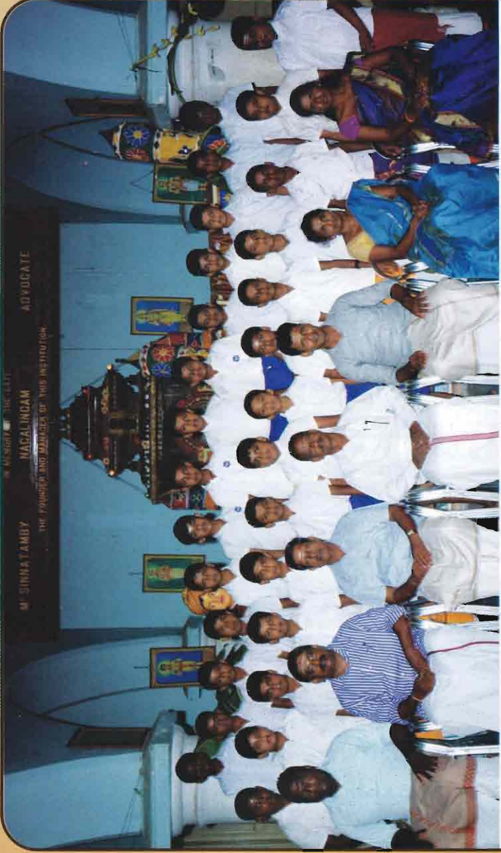
2016 ஆம் ஆண்டு இந்து இளைஞர் கழக அங்கத்துவ உறுப்பினர்கள்