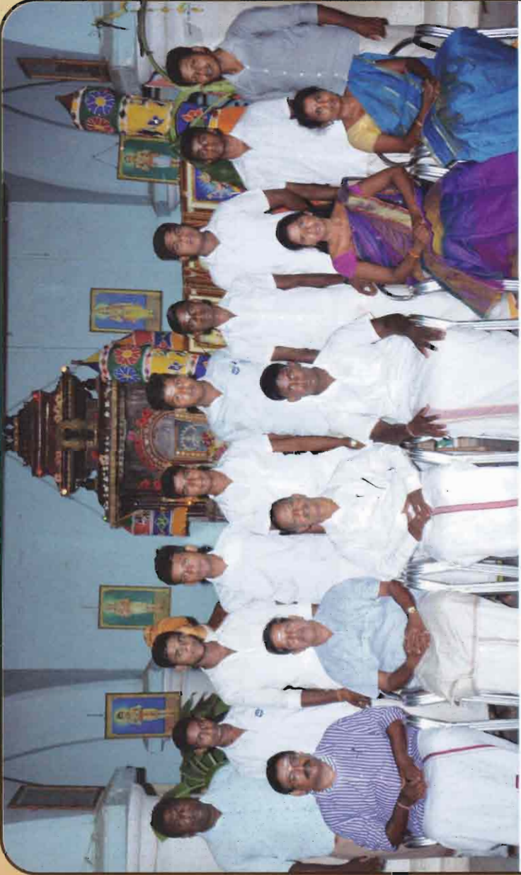
இந்து இளைஞர் கழகம் - 2016