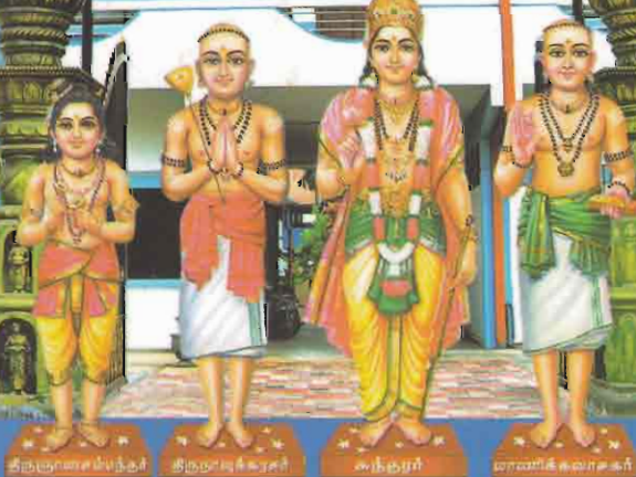
திருமாளையம்மபெருந்தர் திருமாலாவுக்கரசர் கந்தரர் மாணிக்கவாசகர்