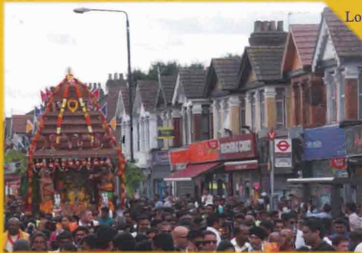
London ஸ்ரீ முருகன் கோயிலின் தேர்த்திருவிழா. London Sri Murugan Temple's Chariot Festival.