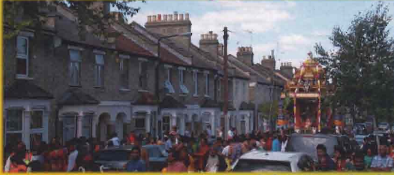
Walthamstow ஸ்ரீ கற்பக விநாயகர் கோவிலின் தேர்த்திருவிழா. Walthamstow Sri Katpaga Vinayagar Temple's Chariot Festival.