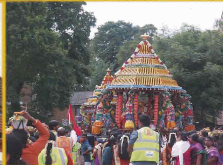
Enfield நாகபூசனி அம்பாள் ஆலயத்தின் தேர்த்திருவிழா. Enfield Nagapooshani Ambaal Temple's Chariot Festival.