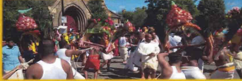
Ealing ஸ்ரீ கனக தூர்க்கை அம்மன் கோயிலின் தேர்த்திருவிழா. Ealing Shri Kanaga Thurkkai Amman Temple's Chariot Festival.