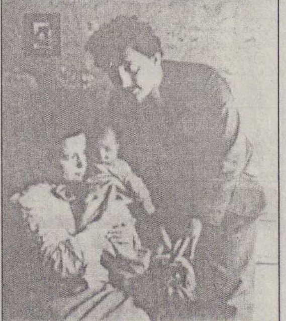
ஐன்ஸ்டீனும் மீலாவும் இரண்டாவது மகனுடன்

ஐன்ஸ்டீனின் இரண்டாவது மனைவி எல்ஷா அவரின் மச்சாள் ஆகும். இவர்கள் இருவரிடமிடையிலுமான வயது வித்தியா