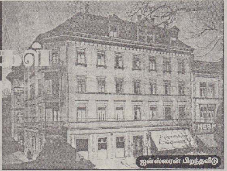
ஐன்ஸ்டீன் பிறந்த வீடு

ஐன்ஸ்டீன் பற்றி எல்ஷா கூறும் போது, ஐன்ஸ்டீனிற்கு அவரின் பெளதிகவியல் கொள்கைகள் பற்றி சம்பந்தமில்லாதவர்கள் கேட்டால் பிடிப்பதில்லை என்றும் கூறியுள்ளார். அத்துடன் வீட்டிற்கு வரும் விருந்தினர்களிடம் ஐன்ஸ்டீனிடம் பெளதிகவியல் கொள்கைகள் பற்றி எதுவுமே கேட்க வேண்டாம் என எல்ஷா அறிவுறுத்துவாராம். அத்துடன் ஐன்ஸ்டீன் தன்னைப்படம் எடுப்பதையும், அவரின் படத்தை வரைய விரும்பும் ஓவியர்களிற்கு முன்னால் அமர்ந்திருப்பதையும் ஒருபோதும் விரும்பியதில்லையாம். ஐன்ஸ்டீன் ஒருமுறை புகைவண்டியில் சென்று கொண்டிருக்கும் போது அவரின் முன்னால் இருந்த ஒருவர் நீண்ட நேரமாக ஐன்ஸ்டீனை உற்றுப்பார்த்துவிட்டு இறுதியில் ‘நீங்கள் என்ன வேலை செய்கிறீர்கள்’ எனக் கேட்டுள்ளார். அதற்கு ஐன்ஸ்டீன் தான் ஒரு ஓவியரின் மாதி (Model) என்று கூறினாராம். மேலும் ஐன்ஸ்டீனிற்கு கையெழுத்திட்டுக்கொடுப்பதிலும் விருப்பம் இருந்ததில்லையாம். ஆயினும் ஒரு காலத்தில் தான் கையெழுத்திட்டுக் கொடுப்பதற்கு