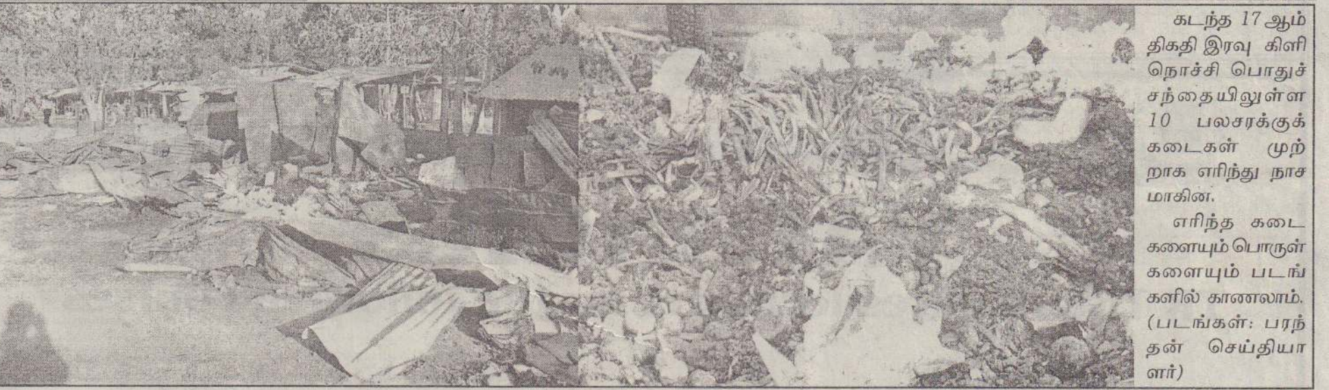
கடந்த 17 ஆம் திகதி இரவு கிளிநொச்சி பொதுச் சந்தையிலுள்ள 10 பலசரக்குக் கடைகள் முற்றாக எரிந்து நாசமாகின. எரிந்த கடைகளையும் பொருள்களையும் படங்களில் காணலாம்.

அத்துடன், நுளம்பு போன்ற பல்வேறு நோய்க் சாவிக்கள் மூலம் சுகாதாரத்திற்கு இடையூறு ஏற்பட வாய்ப்பாக இருப்பதை அவதானிக்கமுடிகிறது. இதுசம்பந்தமாக உரிய வர்கள் கவனமெடுத்து சுகாதாரச்சீர்கேட்டைத் தவிர்ப்பதற்கான நடவடிக்கைகளை மேற்கொள்ள வேண்டும் என அப்பகுதி மக்கள் கேட்டுள்ளனர். (203-341)