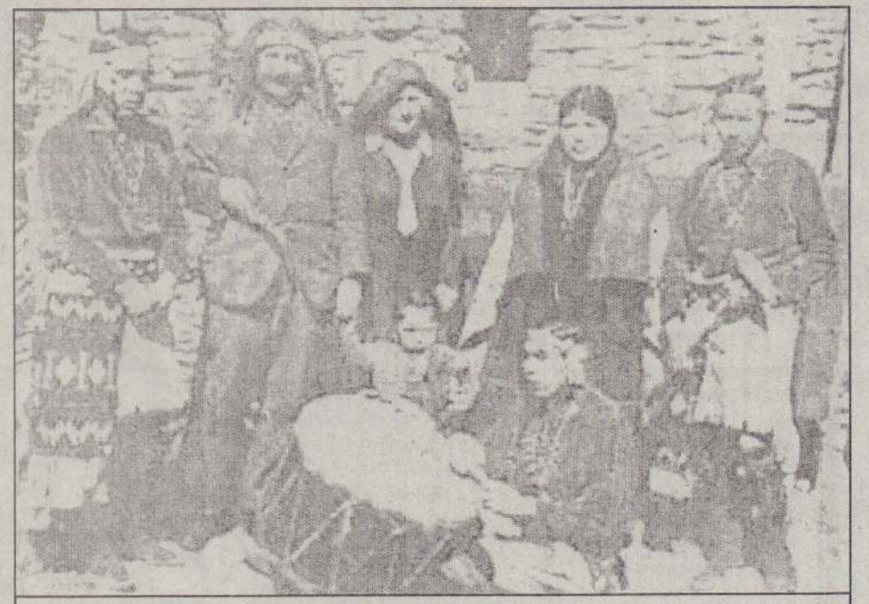
ஐன்ஸ்டீனும் எல்ஷாவும் செவ்வந்தியர்களுடன்

பெரிய உதைபந்தாட்டப் போட்டி நடைபெற இருந்ததாம். அதற்காக மாணவர்களின் பெற்றோரும் பழைய மாணவர்களும் அங்கு கூடியிருந்தனர். ஐன்ஸ்டீன் வருவதைக் கண்டவுடன் அவர்களெல்லாம் உதைபந்தாட்டத்தை மறந்து ஐன்ஸ்டீனை நோக்கி ஓடி வந்தார்களாம். ஆனால், ஐன்ஸ்டீன் தன்னைச் சுற்றி நடப்பதை உணராமல் சாதாரணமாக விவாதித்தபடி நடந்துகொண்டே போனாராம். அதாவது, ஐன்ஸ்டீன் ஒரு விடயத்தைப் பற்றிச் சிந்தித்துக்கொண்டிருக்கும்போது அவருக்கு அவரைச் சுற்றி என்ன நடக்கிறது என்பதை அவர் உணர்வதில்லையாம். அந்த அளவிற்கு அவரால் மனதை ஒருமுகப்படுத்திச் சிந்திக்க முடிந்ததால்தான் இவ்வளவு பாரிய கண்டுபிடிப்புகளை மேற்கொள்ள முடிந்திருக்க வேண்டும்.