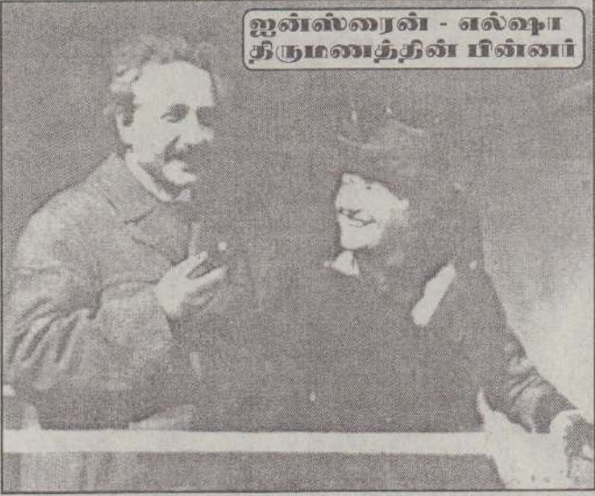
ஐன்ஸ்டீன் - எல்ஷா திருமணத்தின் பின்னர்

மடையத் தொடங்கியதும், 'இந்தப் புகழ் எல்லாம் அவரின் மனித இயல்பிலும் கேடு விளைவிக்கக்கூடிய ஆதிக்கத்தைக் கொண்டு வராது' என நம்புகிறேன்' என்று அவரின் முதலாவது மனைவி மிலீவா கூறினார். ஒருமுறை நெய்ல்ஸ் போர் (Niels Bohr), 'கடவுளுக்கு எதைச் செய்யவேண்டும் என்று சொல்லுவதை நிறுத்து' என்று ஐன்ஸ்டீன் னிற்குக் கூறினார். ஒருமுறை ஆதர் எடிங் ரனிடம் 'ஐன்ஸ்டீனின் தொடர்பியல் கொள்கை உலகிலேயே மூன்று பேருக்கு மட்டுமே புரியும்