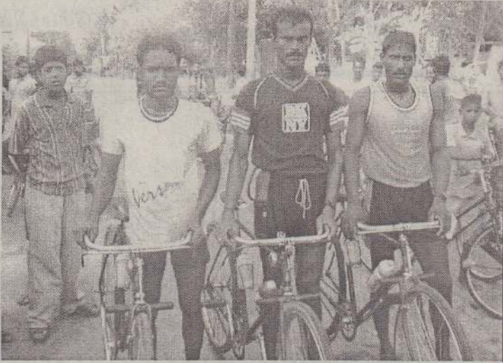
சண்டுக்குளி கிறிஸ்தீல்ட் விளையாட்டுக் கழகத்தின் 47 ஆவது ஆண்டு நிறைவை யொட்டி நடைபெற்ற 25 கிலோமீற்றர் ஆண்களுக்கான சைக்கிள் ஓட்டப் போட்டியில் முதலாவது, இரண்டாவது, மூன்றாவது இடத்தினைப் பெற்றவர்களைப் படத்தில் காணலாம்.

பில் 267 ஓட்டங்களைக் குவித்தது. இலங்கையின் சங்கக்கார 61 ஓட்டங்களையும், ஜயவர்த்தன 52 ஓட்டங்களையும், பாகிஸ்தானின் யுஹானா 42 ஓட்டங்களையும் பெற்றனர். கென்யாவின் ஓடோயோ 3 விக்கெட்டுக்களையும், சிம்பாப்வேயின் ஸ்டீக் 2 விக்கெட்டுக்களையும் வீழ்த்தினர். அடுத்து களமிறங்கிய ஆபிரிக்க லெவன் அணி 49.2 ஓவரில் சகலவிக்கெட்டுக்களையும் இழந்து 250 ஓட்டங்களை மட்டுமே பெற்றது. டிகோலோ 43 ஓட்டங்களையும், வியர்ஸ், கெம்ப ஆகியோர் தலா 39 ஓட்டங்களையும் பெற்றனர். கான் 3 விக்கெட்டுகளையும் அக்தர் 2 விக்கெட்டுகளையும் வீழ்த்தினர். (203)