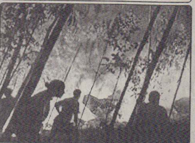
போர்த்துக்கல் நாட்டின் மத்திய மற்றும் வடக்குப் பிரதேசங்களில் மூண்டுள்ள காட்டுத் தீயால் பெரும்பாதிப்பு ஏற்பட்டுள்ளது. நாட்டின் முன்னாள் பெரிய நகரான கொய்ராவின் எல்லையை காட்டுத் தீ நெருங்குகிறது. நகருக்குள் தீ பரவாது தடுக்க தீயணைப்பு வீரர்கள் போரடி வருகின்றனர்.