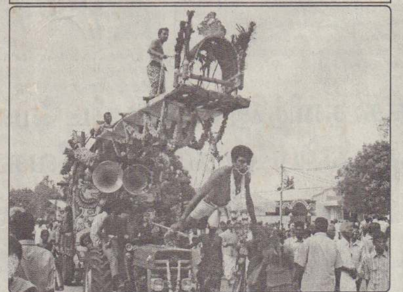
காவடி எடுத்து நேர்த்திக்கடனை நிறைவேற்றும் அடியவார்.