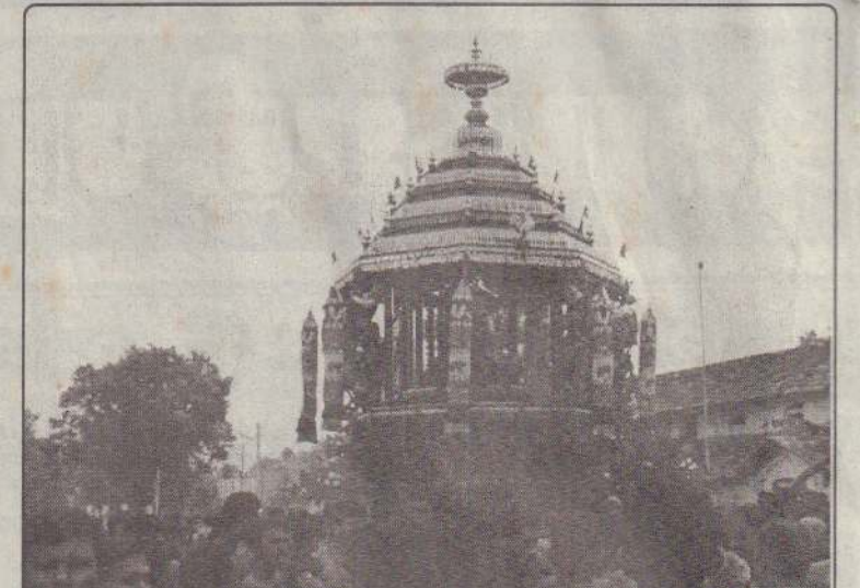
வடக்கு வீதியில் அசைந்து வரும் சித்திரத் தேர்.