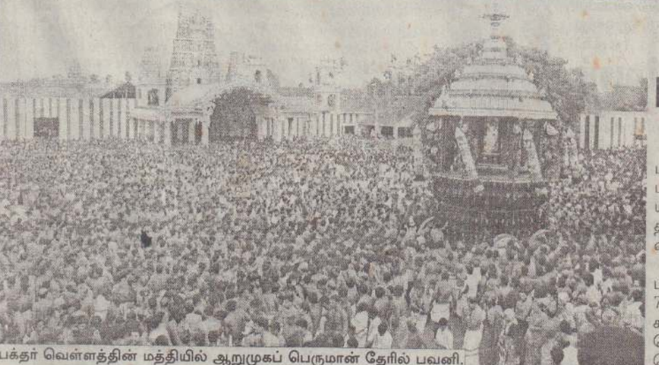
பக்தர் வெள்ளத்தின் மத்தியில் ஆறுமுகப் பெருமான் தேரில் பவனி.

தனக்கு ஒருகை இல்லாதிருப்பதால் தம்மை அடையாள அணிவகுப்பில் எவரும் இலகு (14 ஆம் பக்கம் பார்க்க)