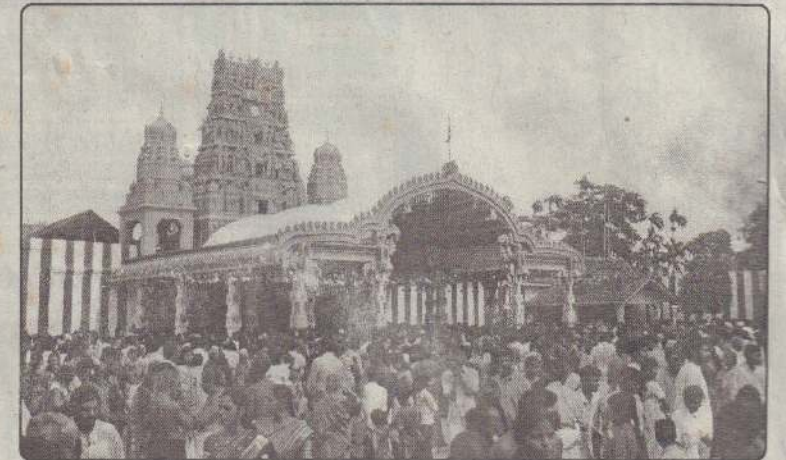
ஆலய முன்றலில் பக்தர் வெள்ளம்.