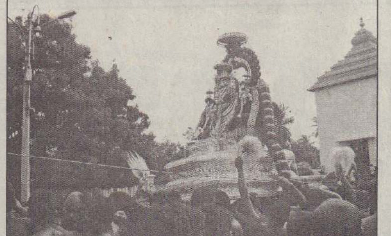
பச்சை சாத்தி ஆறுமுகப் பெருமான் தேரில் இருந்து அவரோசனிக் கின்றார்.