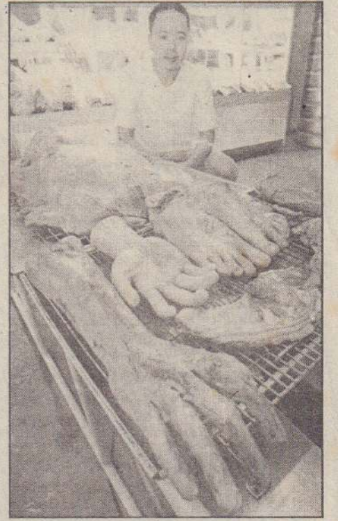
இது என்ன மாமிசக் கடை என்று எண்ணத் தோன்றுகின்றதா? இல்லை. தாய் லாந்தின் பாங்கொக் நகரில் உள்ள உணவகம் ஒன்றில் மனித உறுப்புகள் போன்று தயாரிக்கப்பட்ட ரொட்டிகளை விற்பனை செய்வதில் ஒருவர் ஈடுபட்டிருப்பதையே படத்தில் காண்கிறீர்கள்.

மெக்ஸிகோவின், மான்டெரியில் நடந்த மேம்பாட்டுக்கான நிதி குறித்த சர்வதேச மாநாடு மற்றும் தென் ஆபிரிக்காவின் ஜோஹானஸ்பர்க்கில் நடந்த நீடித்த வளர்ச்சி உச்சி மாநாட்டிலும், 2002ஆம் ஆண்டு மீண்டும் உறுதி செய்யப்பட்ட 'மேம்பாட்டுக்கான உலகளாவிய கூட்டாளித்துவம்' என்ற