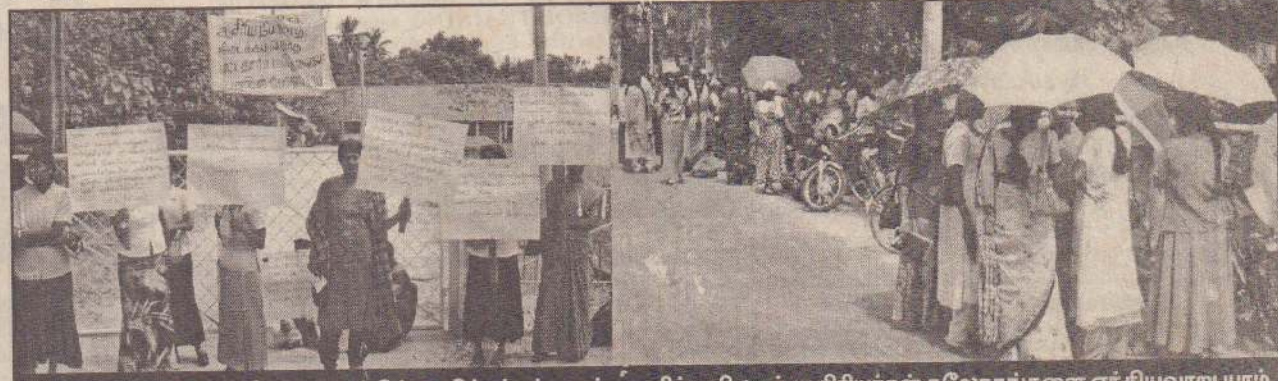
நேற்றைய மறியல் போராட்டத்தில் பாதிக்கப்பட்ட பட்டதாரிப் பயிலுநர் ஆசிரியர்கள் சுலோகங்களை ஏந்தியவாறு யாழ்வலயம் முன்பாக மறியல் செய்தனர்.

இவற்றின் பிரதிகள் ஜனாதிபதி, பிரதமர், வடக்கு-கிழக்கு மாகாண ஆளுநர், ஐ.தே.கட்சித் தலைவர், அமைச்சர் டக்ளஸ் தேவானந்தா, தமிழகக் கட்சிச் செயலாளர், இலங்கை தமிழ் ஆசிரிய சங்கச் செயலாளர், யாழ்வலயத் தமிழ் ஆசிரியர் சங்கச் செயலாளர், வடக்கு - கிழக்கு மாகாணக் கல்வி அமைச்சின் செயலாளர் ஆகியோருக்கும் அனுப்பி வைக்கப்படவிருப்பதாக தெரிவிக்கப்படுகிறது. (த-12-ரி)