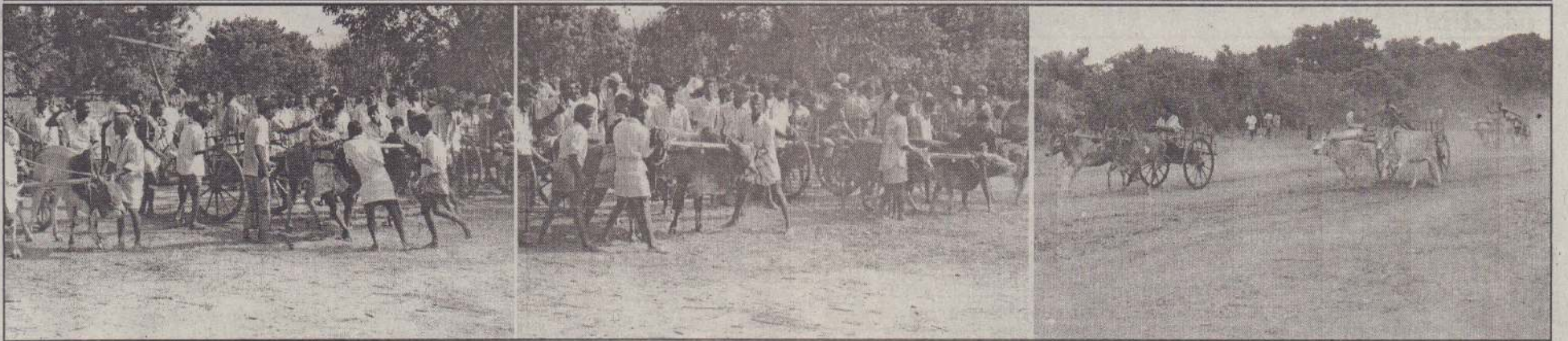
விசுவமடுவில் நடந்த மாபெரும் மாட்டுவண்டியில் சவாரிப் போட்டியில் பற்கேற்க காளைகள் தயார் நிலையில் நிற்பதையும் போட்டியில் காளைகள் ஓடக் கொண்டிருப்பதையும் படங்களில் காணலாம்.