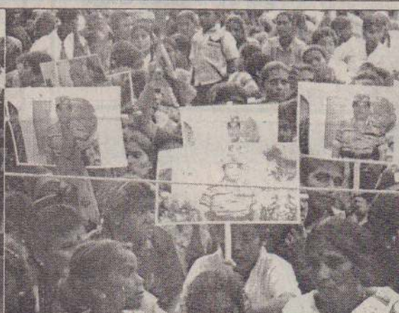
உரிமையைப் பெறுவதற்காக உயிராயுதமாகத் துணிந்த மக்களின் உள்ள எண்ணங்களை வெளிப்படுத்தும் காட்சிகள்.