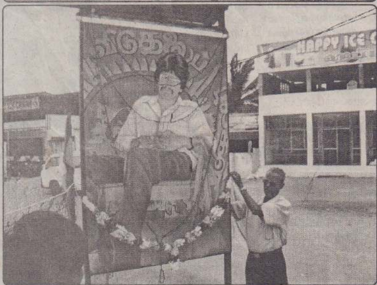
நல்லூர் நினைவுத் தூபியில்....