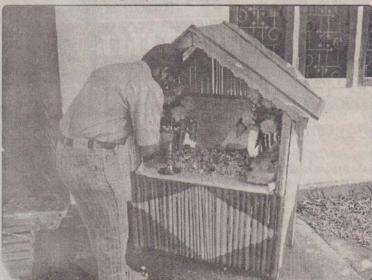
மாவட்ட பேரவை அலுவலகத்தில்.... (படங்கள்:- பகிர்)