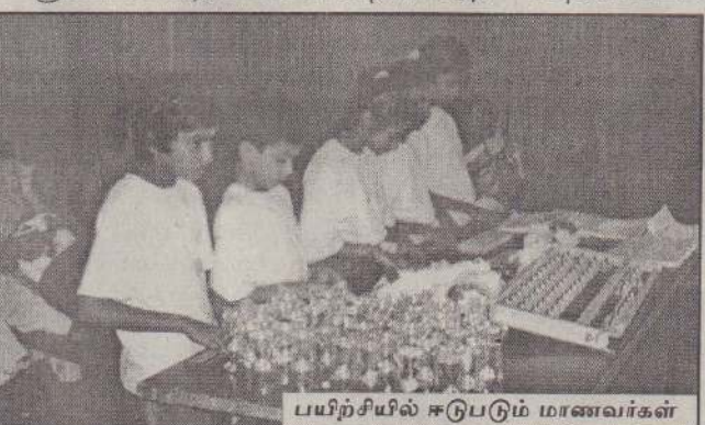
பயிற்சியில் ஈடுபடும் மாணவர்கள்

இந்த பயிற்சித் திட்டத்தில் 10 நிலைகள் உள்ளன. இது 30 மாதத் திட்டமாகவே நடத்தப்படுகின்றது. ஒவ்வொரு நிலைகளிலும்