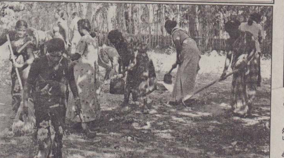
தியாகி லெப்.கேணல் திலீபனின் நினைவு நாளை முன்னிட்டு கிளிநொச்சி பெண்கள் மேம்பாட்டுக் குழுவின் ஏற்பாட்டில் கிராம அமைப்புகளைச் சேர்ந்தவர்கள் விசுவமடு மாவீரர் மண்டபத்தில் கடந்த விடியாழக்கிழமை சீரமதானம் மேற்கொண்டனர்.