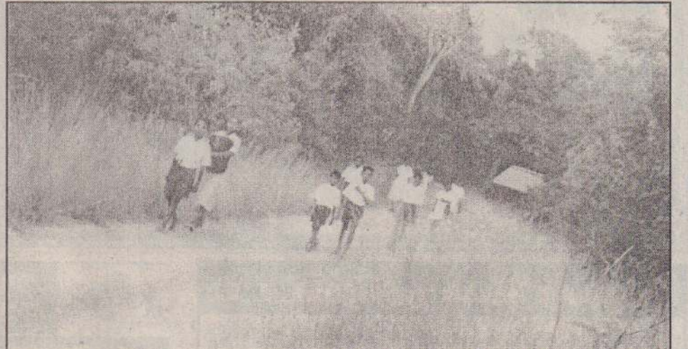
செக்காலை, அரசபுரம் கிராம மாணவர்கள் காடுகள் அடர்ந்த பாதையூடாகக் கால்நடையில் செல்வதைப் படத்தில் காணலாம்.