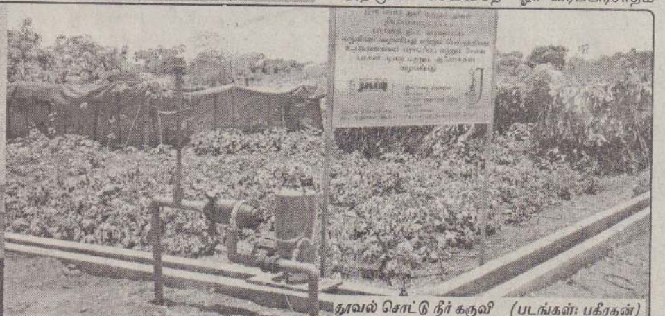
தூவல் சொட்டு நீர் கருவி

அவர்களுக்கு இவை தொடர்பான விளக்கங்களை அளித்துள்ளோம். அவர்கள்தானே விவசாயிகளுக்கு வழிகாட்டுபவர்கள். அவர்கள், தமது சந்தேகங்களையும் கேட்டுத் தெளிவுபெற்றனர்.