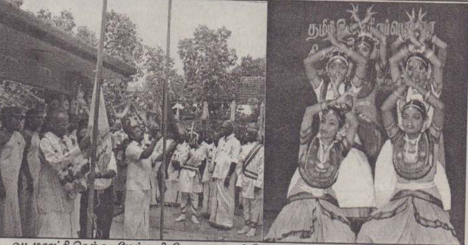
வடமராட்சி தெற்கு- மேற்கு பிரதேச கலாசாரப் பேரவை நடத்திய கலை இலக்கியப் பெரு விழாவின் ஆரம்ப நாள் நிகழ்வில் விருந்தினர்கள் அழைத்துவரப்படுவதையும் கொடியேற்ற நிகழ்வு இடம்பெறுவதையும் நடைபெற்ற கலை நிகழ்வுகளில் ஒன்றையும் படங்களில் காணலாம்.