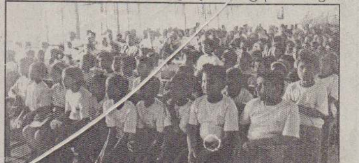
யூசிமாஸ் பயிற்சியில் ஈடுபடும் மாணவர்களுக்கான சான்றிதழ் வழங்கும் நிகழ்வில் கலந்து கொண்ட மாணவர்கள்

பதில்: யூசிமாஸ் என்பதன் விரிவாக்கம் யுனிவர்சல் கான்செப்ட் மெண்டல் அரித்மெடிக் சிஸ்டம் என்பதாகும். இது குழந்தைகளின் அறிவாற்றலை நான்கு வயதில் இருந்தே பன்மடங்கு பெருக்குகின்றது. முறையான வழிகாட்டல் மூலம் குழந்தைகளிடம் புதைந்துள்ள அறிவாற்றல் வெளிக்கொணரப்படுகின்றது. குழந்தைகளுக்கு அபாக்கல் எனும் கருவியின் மூலம் கூட்டல், கழித்தல், பெருக்கம், வகுத்தல் ஆகிய கணக்குகளில் பயிற்சிகள் வழங்கப்படுகின்றன. இதன்மூலம் பயிற்சிகளைப் பெற்ற குழந்தை அடுத்த சில