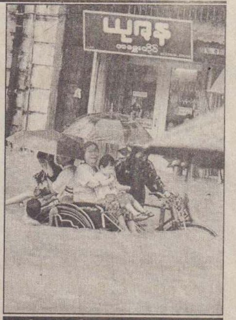
ரியான்மார்ன் தலைநகர் யாங்கூவில் கரும் மழை கொட்டுகிறது. வெள்ளத்துக்கும் மத்தியில் மக்கள் பாதாபாயான இடங்களை நோக்கி நகர்கின்றனர். அங்குள்ள குடும்பமொன்று ரிச்சோ ஒன்றில் தமது உடைமையையும் கொண்டு வெளியேறுவதைப் பிடித்துக் காணலாம்.

கான முடிவுகள் எதிர்வரும் ஒக்டோபர் மாதம் 2ஆம் திகதியே வெளிவரும். ஆனால், அதிகார சமநிலையை எதிர்வு கூறக்கூடிய எந்த சமிக்ஞையையும் அது காட்டவில்லை. அங்கு வேட்பாளர் ஒருவர் இறந்ததன் காரணமாக வாக்களிப்பு தாமதமடைந்துள்ளது. (க)