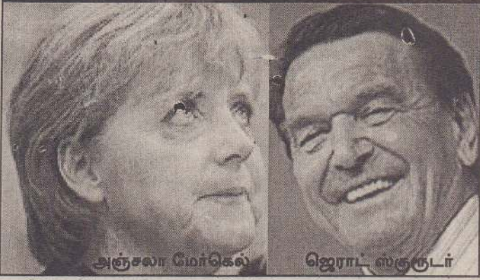
அஞ்சலா மேர்கெல் ஜெராட் ஸ்கூருடர்

பெர்லின், செப்ரெம்பர் 20 ஜேர்மன் பொதுத் தேர்தலில் பழமைவாதக் கட்சி வெறும் மூன்று ஆசனங்களால் வெற்றிபெற்றுள்ளது. இதன் மூலம் நாட்டில் அரசியல் அந்தகார தெளிவற்ற நிலை ஒன்று தோன்றியுள்ளது. உத்தியோகபூர்வத் தேர்தல் முடிவுகளின்படி அஞ்சலா மேர்கெல்லின் தலைமையிலான பழமைவாதிகள் கட்சி வெற்றிபெற்றதாக அறிவிக்கப்பட்டுள்ளது. அவர்களது கிறிஸ்தவ ஜனநாயகக் கட்சி 35.2 சதவீத வாக்குகளைப் பெற்று 225 ஆசனங்களையும் தற்போதைய அதிபர் ஜெராட் ஸ்கூருடர் தலைமையிலான சோஷலிச ஜனநாயகக் கட்சி 34.3 சதவீத வாக்குகளையும் பெற்றுள்ளனர்.