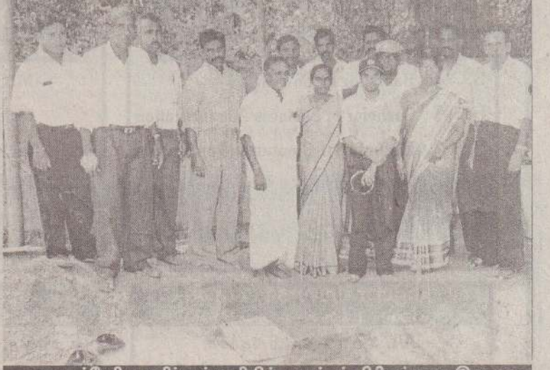
சாவகச்சேரி மகளிர் கல்லூரியில் ஆரம்பப் பிரிவுக்கான இரு மாடி வகுப்பறைக் கட்டடம் அமைக்கப்பட்டுள்ளது. இக்கட்டடம் அமைப்பதற்கான அடிக்கல் நட்டம் விழா அண்மையில் இடம்பெற்றது. நிகழ்வில் கட்டடத்திற்கு நிதி வழங்கும் சவில்ஸ் அபிவிருத்திக் கூட்டுத்தாபன பொறியியலாளர்களுடன் கல்லூரி அதிபர் உட்பட ஏனையோரும் காணப்படுகின்றனர்.