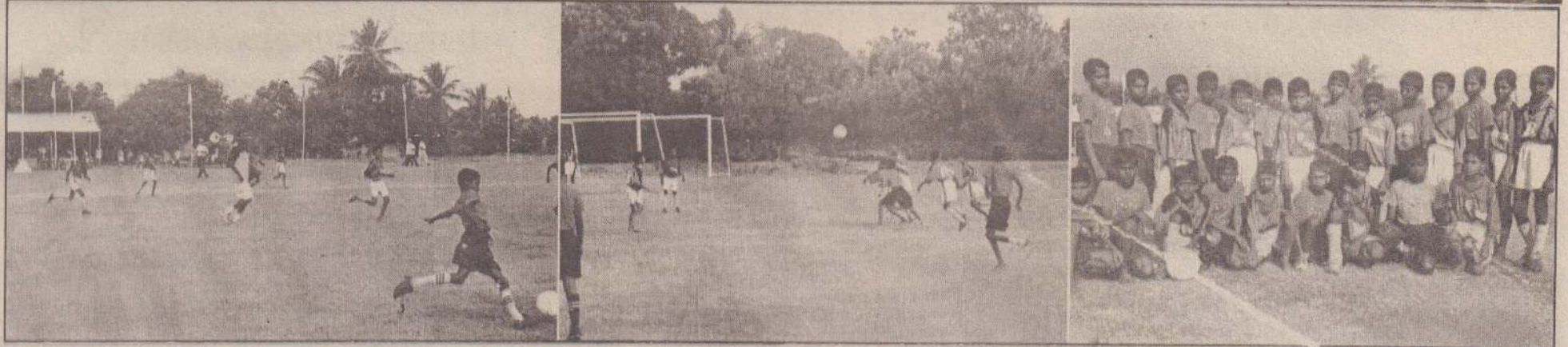
இளையோர் செயற்பாட்டு அமைப்பின் ஏற்பாட்டில் 13,15 வயதுப் பிரிவினருக்கான உதைபந்தாட்டச் சுற்றுப்போட்டி கிளிநொச்சியில் நடத்தப்பட்டது. இச்சுற்றுப்போட்டியின் இறுதியாட்டம் நேற்றுமுன்தினம் இடம்பெற்றது. அதன்போது எடுக்கப்பட்ட படங்கள் இவை. இரு அணியினரும் விளையாடுவதையும் பங்குபற்றிய மாணவர்களையும் படங்களில் காணலாம்.