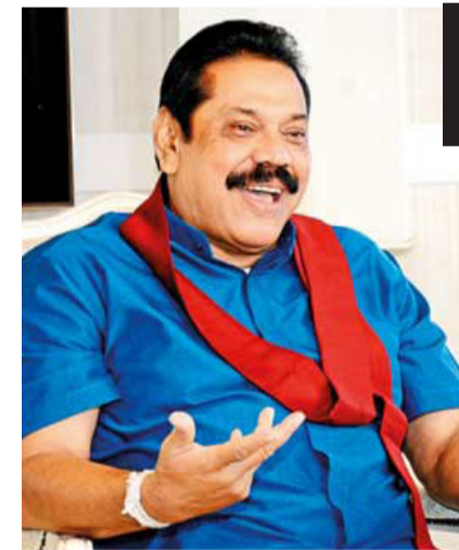
மஹிந்த ராஜபக்ஷ கூறுகிறார்

டம் எவ்வித திட்டமும் கிடையாது. வெளிநாட்டிலிருந்து