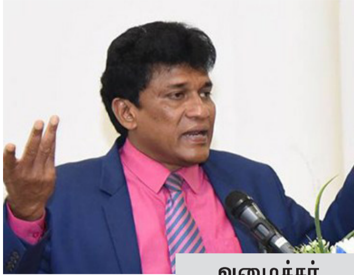
அமைச்சர் மனோ கணேசன் கூறுகிறார்

இதுதொடர்பில் அவர் மேலும் தெரிவித்தவை வருமாறு:-