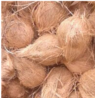
அதிகார சபையினால் திடீர்

தேங்காய் ஒன்றின் அதிக பட்ச சில்லறை விலை 75 ரூபா என அண்மையில் வர்த்தமானி அறிவித்தல் மூலம் பிரகடனப்படுத்தப்பட்டிருந்த நிலையில், நாடு முழுவதும் நுகர்வோர் விவகார