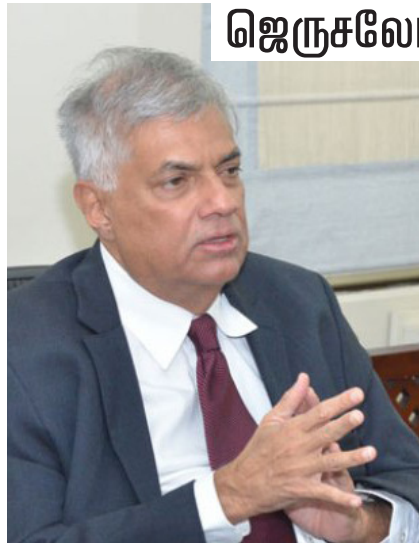
விண் நிலைப்பாட்டுக்கு ஆதரவளிக்க முடியாது என்றும் இலங்கை அரசு

இந்தநிலையில், பலஸ்தீனம் தொடர்பான இலங்கையின் கொள்கையில் மாற்றமில்லை என்றும், அமெரிக்கா