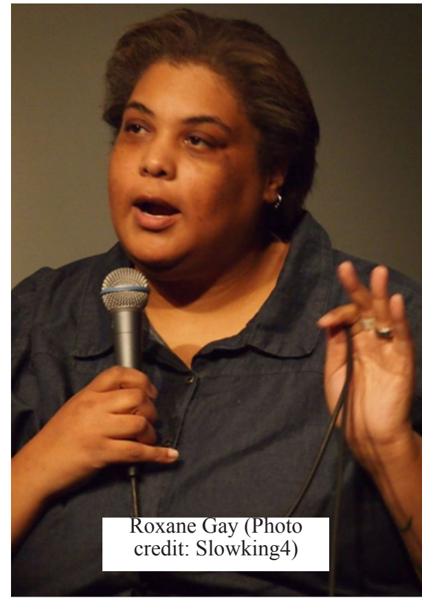
Roxane Gay

எதிரான எதிர்ப்புகள் விடயத்தில், ரோக்லான் கேய் (Roxane Gay) நியூ யோர்க் டைம்ஸில், “பெயர்கூறாமல் வெளிப்படுத்துவதிலான அவதூறு மற்றும் அறநெறி குறித்து நிறைய கை பிசையப்படுகின்றது” என்று கடுமையாகப் புகார்கூறினார்.