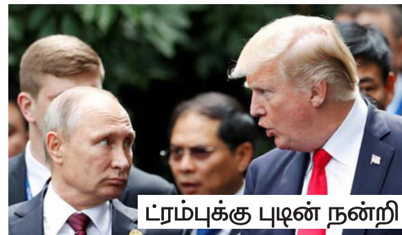
ட்ரம்புக்கு புடின் நன்றி