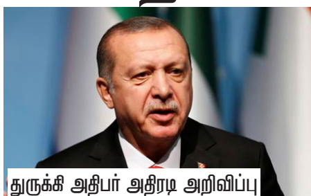
துருக்கி அதிபர் அதிர்ஷ்ட அறிவிப்பு

கடந்தாண்டு அமெரிக்க அதிபர் தேர்தல் பிரசாரத்தின் போது, ஜெருசலேமில் அமெரிக்கத் தூதரகம் அமைக்கப்படும் என ட்ரம்பின் குறிப்பிட்டிருந்தார்.