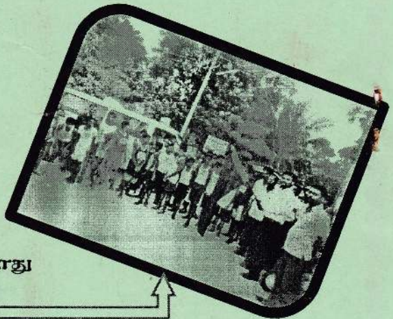
விணையாட்டு நகழ்வின் போது