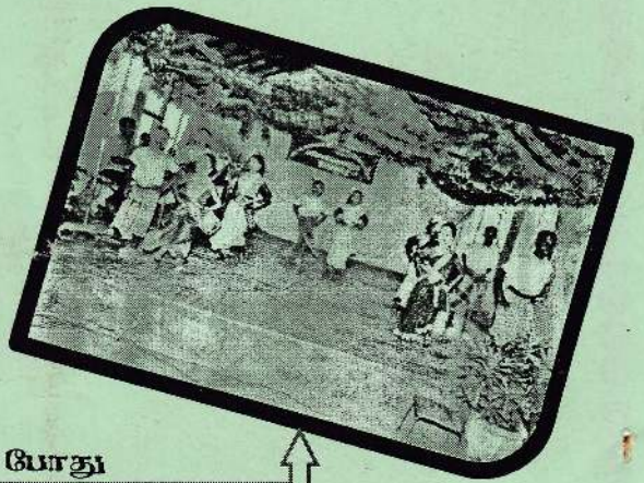
பாசனப்பு விழாவின் (2012) போது