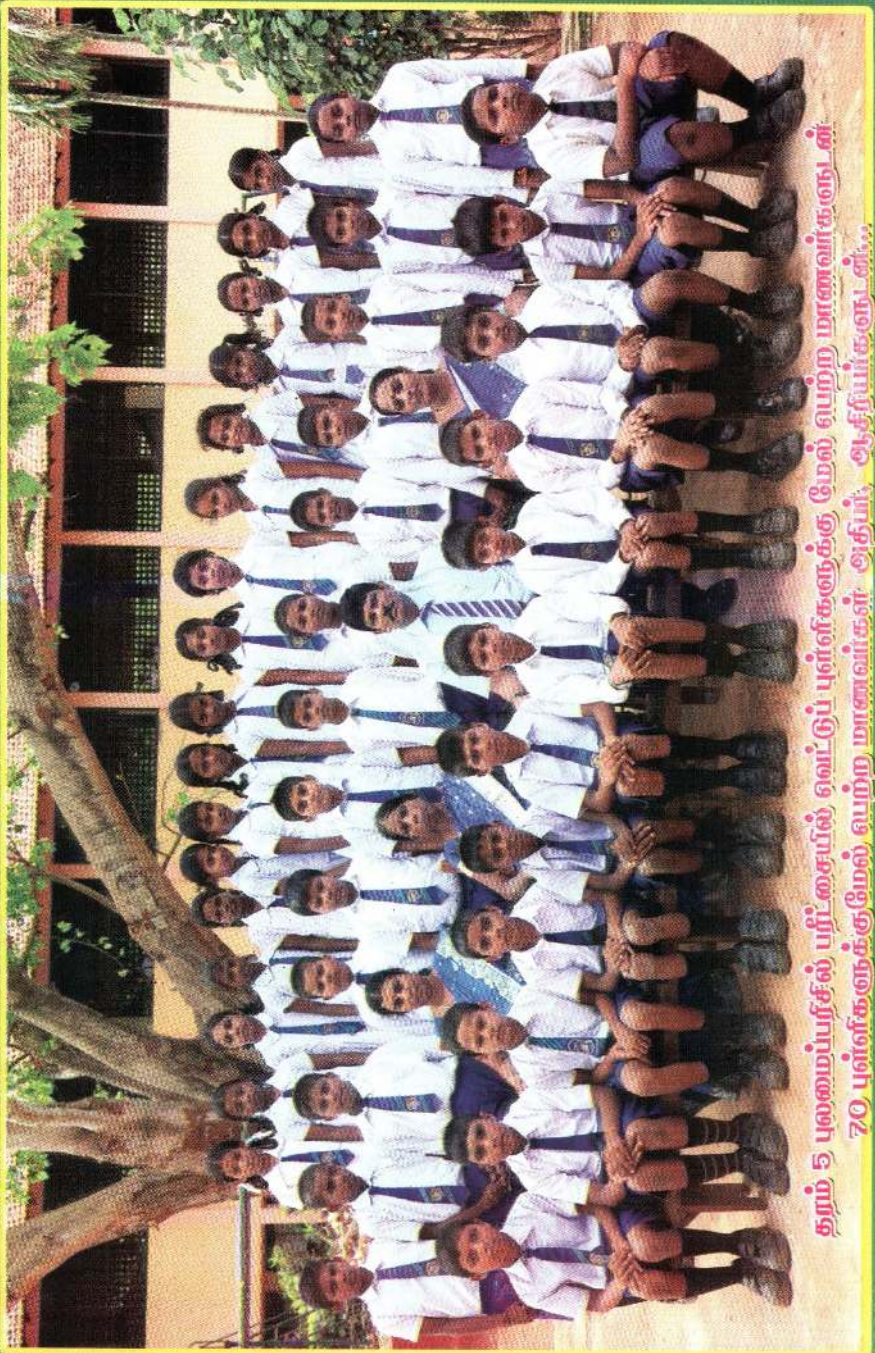
தரம் 5 புலமைப்பரிசில் பரிசுசெயில் வெட்டுப் புள்ளிகளுக்கு மேல் வற்ற மாணவர்களுடன் 70 புள்ளிகளுக்குமேல் வற்ற மாணவர்கள் அதிர்வு ஆசிரியர்களுடன்...