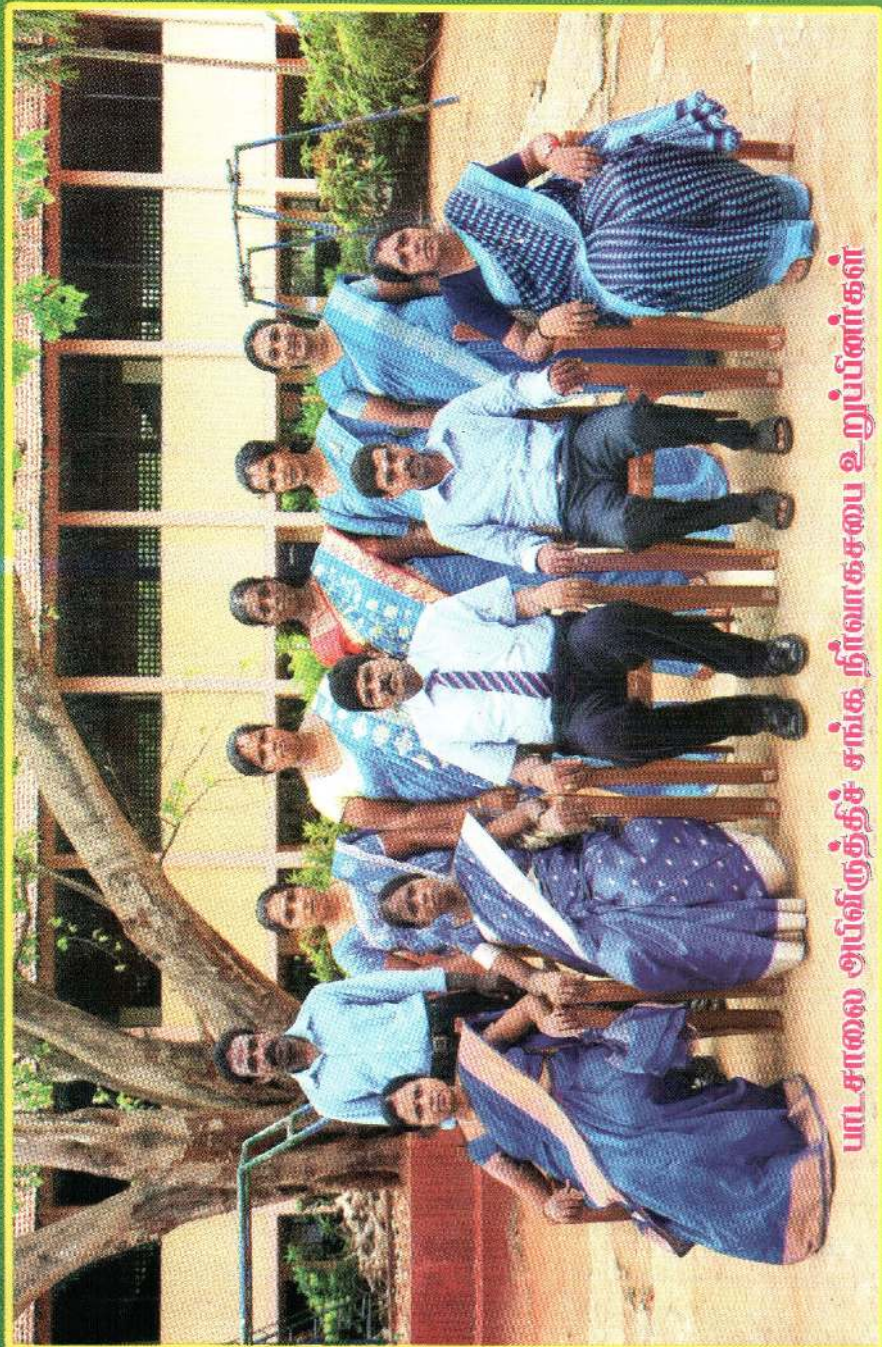
புது சாலை அபிவிருத்திச் சங்க நிர்வாகசபை உறுப்பினர்கள்