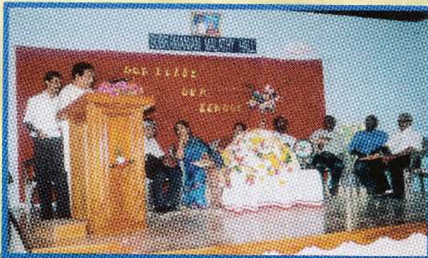
கொக்குவில் இந்து ஆரம்ப பாடசாலை திறப்பு விழா