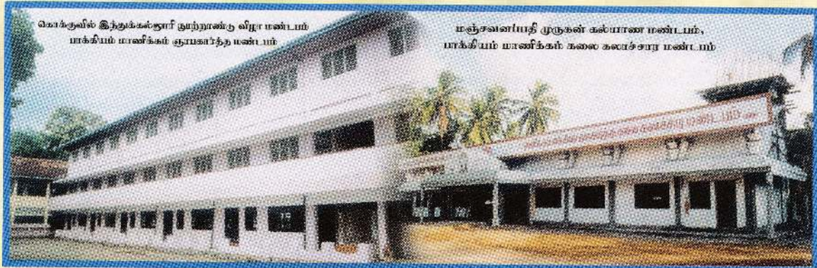
கொக்குவில் இந்துக்கல்லூரி நுழைவணிக விழா மண்டபம் பாக்கியம் மாணிக்கம் சூயகாந்த மண்டபம்