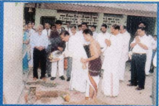
கொழும்பு இந்துக்கல்லூரி முன்று மாடிக் கட்டிட அத்திவாரமீடல்