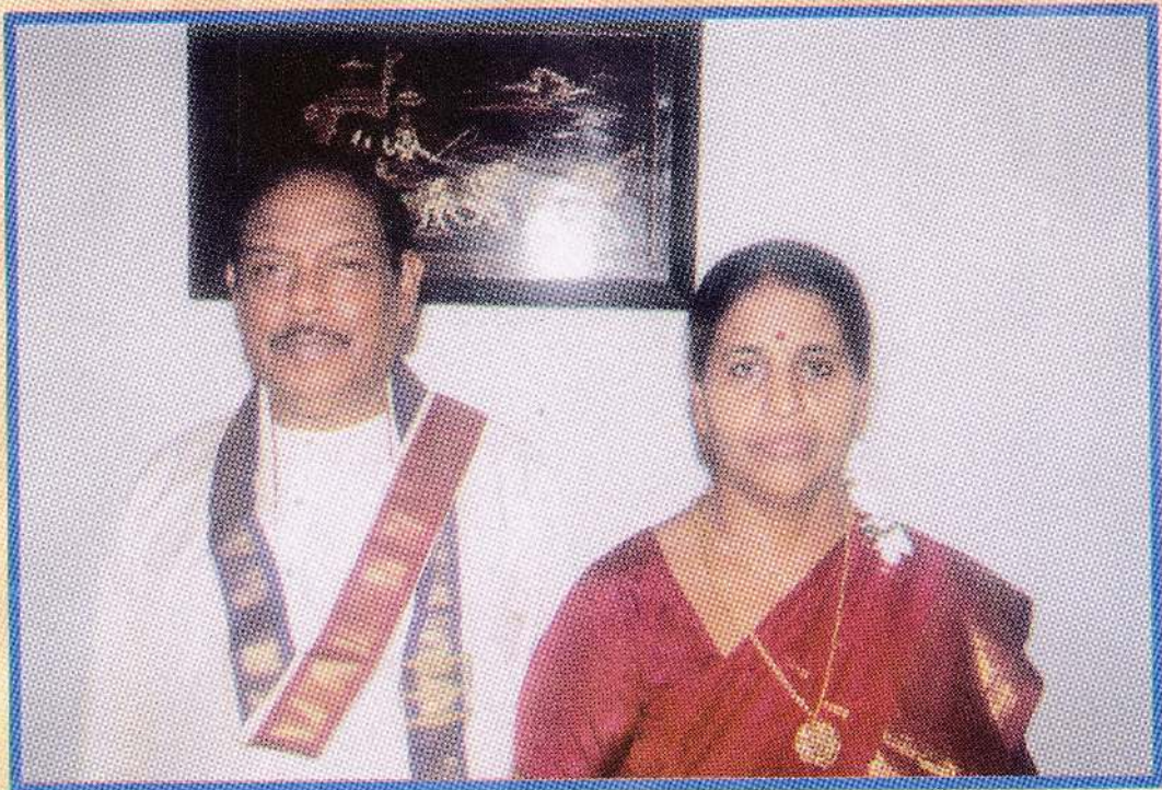
திரு அபிரமணியம் தம்பதிகள்