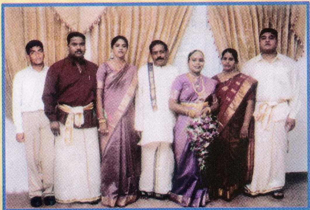
திரு அபிரமணியம் குடும்பத்தினர்