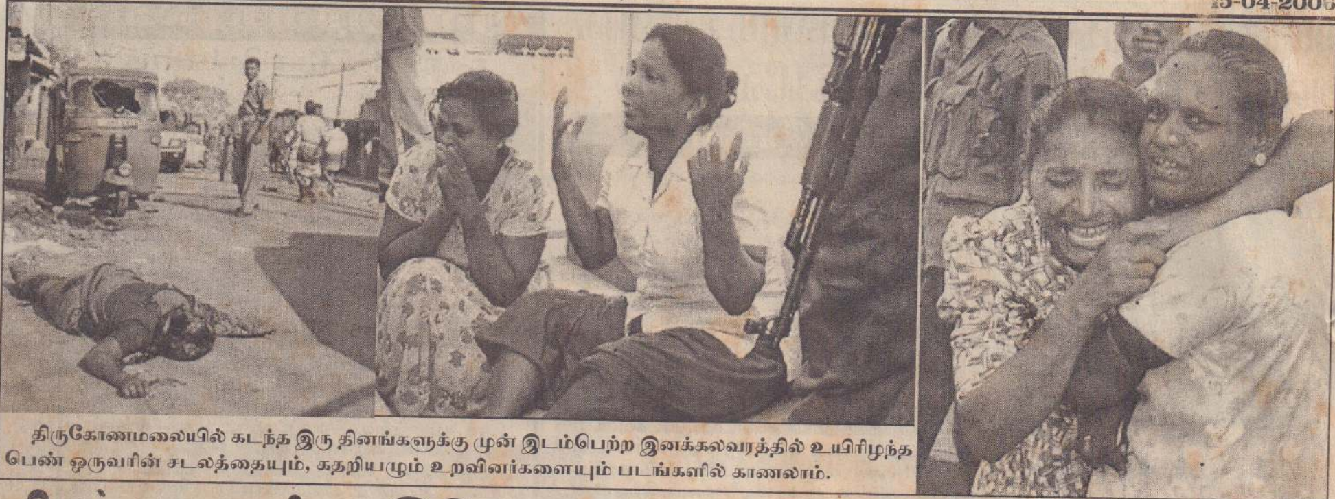
திருகோணமலையில் கடந்த இரு தினங்களுக்கு முன் இடம்பெற்ற இனக்கலவரத்தில் உயிரிழந்த பெண் ஒருவரின் சடலத்தையும், கதறியழும் உறவினர்களையும் படங்களில் காணலாம்.