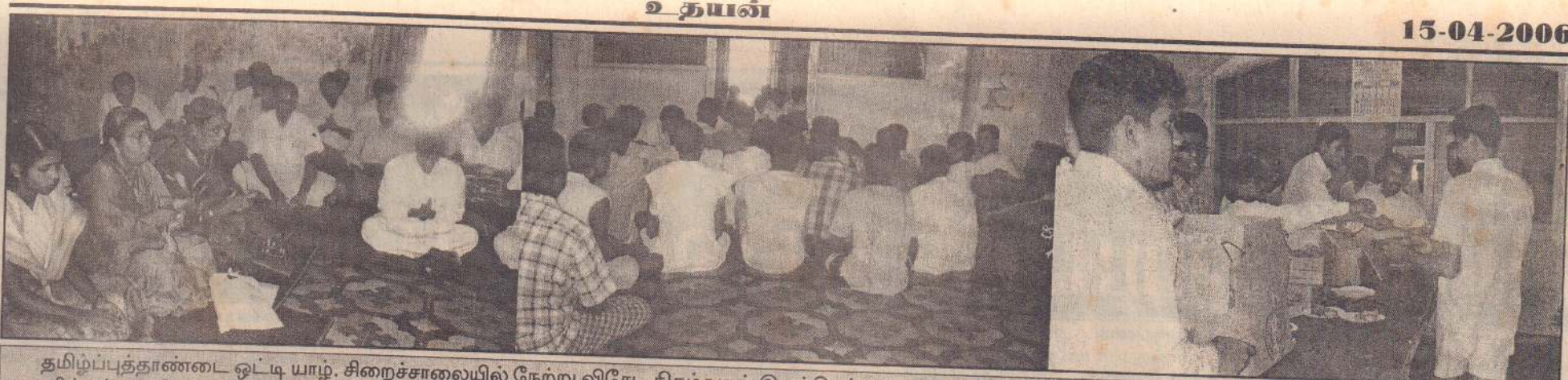
தமிழ்ப்புத்தாண்டை ஒட்டி யாழ். சிறைச்சாலையில் நேற்று விசேட நிகழ்வுகள் இடம்பெற்றன. யாழ். சிறைச்சாலை நலன்புரிச் சங்கத்தின் ஏற்பாட்டில் நடந்த இந்நிகழ்வுகளில் சுத்யசாயி பஜனைக் குழுவின் பக்திப் பாடல்களை இசைப்பதையும் நிகழ்வில் பங்கேற்ற சைதிகளில் ஒருபகுதியினரையும் நிகழ்வின் இறுதியில் புதுவருடச் சிறுணர்வுகள் வழங்கப்படுவதையும் படங்களில் காணலாம்.