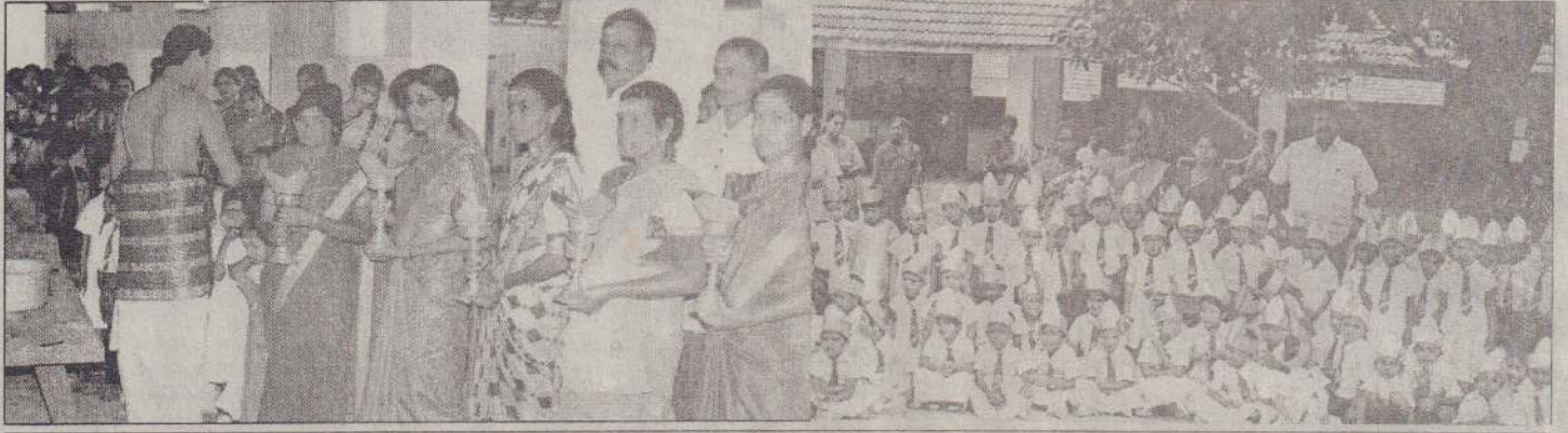
இராமநாதபுரம் மகாவித்தியாலத்தில் கடந்த 17 ஆம் திகதி நடைபெற்ற தரம் - 01 மாணவர்களை வரவேற்கும் நிகழ்வில் போது ஏடுக்கப்பட்ட படங்கள் இவை. இராமநாதபுரம் மாவட்டம் மன்ன ஆலயத்தில் விசேட வழிபாடுகள் இடம்பெறுவதையும் வரவேற்கப்பட்ட தரம் - 01 மாணவர்களுடன் அதிபர், வகுப்பாசிரியர்கள் நிற்பதையும் படங்களில் காணலாம். (த-405)

அன்றையதினம் பிற்பகல் 3 மணியளவில் கிளிநொச்சி வைத்திய நிலையத்திலிருந்து ஒரு நோயாளியை ஏற்றிக்கொண்டு அம்புலன்ஸ் வண்டியொன்று சென்றது. அது மாலை 6.30 மணியளவில் திரும்பிவந்தபோது ஓமந்தை சோதனைச் சாவடியில் சிறிலங்கா இராணுவத்தால் தொடர்ந்து பிரயாணத்தை மேற்கொள்ள அனுமதிக்கப்படவில்லை. அடுத்த நாள் காலை யிலேயே அம்புலன்ஸ் திரும்பிவர அனுமதிக்கப்பட்டுள்ளது. இதனால் அன்றிரவு முழுவதும் எமது வைத்தியசாலையில் அவசர தேவைகளுக்கு அம்புலன்ஸ் வண்டியின் சேவையை பெற்றுக்கொள்ள முடியாமல் போய்விட்டது. இம்மாதிரியான சந்தர்ப்பங்களில் அம்புலன்ஸ் வண்டிகள் 24 மணிநேரமும் 24 மணி நேரமும் வகையில் சோதனைச் சாவடிகளில் தடுத்து நிறுத்தாமலிருக்க உதவியும் படி டாக்டர் சதானந்தன் கண்காணிப்புக் குழுவிடம் கோரியுள்ளார். (ப)