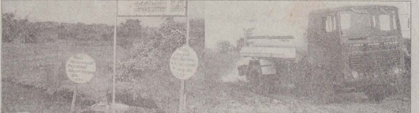
கிளிநொச்சி கலாநிதி பிரதேச சபையின் ஆணைக்கு உட்பட்ட பிரதேசமான பரந்தன் ஏரிக்கும் ஆணையிறவு உப்பளக்குக்கும் இடைப்பட்ட உணையாள் புரம் பகுதியில் ஏ-9 வீதிக்கு சமீபமாக கழிவுப் பொருள்கள் கொட்டப்படுகின்றன. இதனால் அங்கு பெரும் குர்நாற்றம் வீசுகின்றது. *கழிவுப் பொருள்கள் கொட்டப்படும் இடத்தில் சமீபமாக வாகனம் ஒன்று கழிவுகளை அகற்றிக் கொண்டிருப்பதையே படத்தில் காண்கிறீர்கள். Digitized by Noolaham Foundation. noolaham.org | aavanaham.org

* அனைத்து உணவு கையாளும் நிலைய உரிமையாளர்களுக்கும் பணியாளர்களுக்கும் மருத்துவ ஆய்வு மேற்கொண்டு அடையாள அட்டை வழங்குதல். (த-6-355)