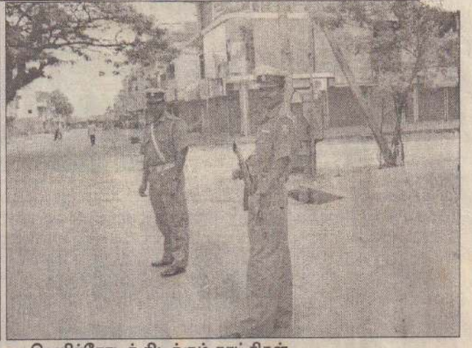
வவுனியாவில் நேற்று இடம்பெற்ற ஹர்த்தாலினால் பிரதான சாலைகள் கடைத் தொகுதிகள் என்பன வெறிச்சோடிக் கிடக்கும் காட்சிகள்.