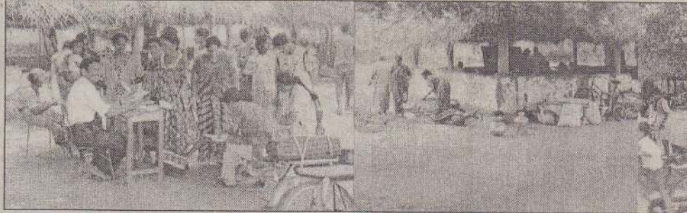
காரைநகர் தோப்புக்காட்டிலிருந்து இடம்பெயர்ந்த மக்கள் பூநகரிப் பிரதேசத்திலுள்ள வேரவில் இந்து மகா வித்தியாலயத்தில் தங்கியுள்ளனர். அங்கு தங்கியுள்ள மக்களின் விவரங்களைப் பொருள்வெளி கிராம சேவைப்பணி செய்வதை முதலாவது படத்திலும் - மக்கள் பாடசாலையில் தங்கவைக்கப்பட்டிருப்பதை அடுத்துள்ள படங்களிலும் காணலாம்.

கண்காட்சியில் கேணல் கிட்டுவினால் வரையப்பட்ட 16 அற்புதமான ஓவியங்கள்