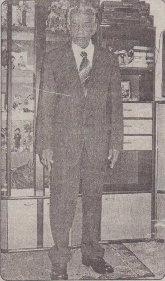
கந்தசாமி கோயிலடி, நீர்வேலி தெற்கு, நீர்வேலி.