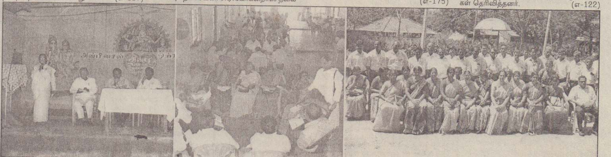
இலங்கை பிரம்மகுமாரிகள் இராஜயோக நிலையம் 'அன்பிளால் ஒற்றுமை' என்னும் பெயரில் அமைதிச் செயற்றிட்டம் ஒன்றை அகில இலங்கைநிலையில் நடத்திவருகின்றது. இந்தச் செயற்றிட்டத்தின் குடாநாட்டுக்கான ஆரம்ப நிகழ்வு நேற்றுமுன்தினம் மருதனார்மடம் இராமநாதன் கல்லூரியில் நடைபெற்றது. நிகழ்வில் எடுக்கப்பட்ட துணைப்புகள், இராஜயோக நிலையப் பிரதிநிதிகள், வலிகாமம் வலயக் கல்வி அதிகாரிகள், அறிபர்கள், ஆசிரியர்கள், மாண்புமிகு உறுப்பினர்கள் கலந்துகொண்டு கலந்துகொண்டனர்.

யாழ்ப்பாணம், பெப்.20 வரணிப் பிரதேசத்தில் பரவலாகப் படை முகாம்கள் அமைந்துள்ள காணிகளில் உள்ள பனைமரங்கள், தென்னைகள் படை யினரால் தறிக்கப்பட்டு வருகின்றன. இவ்வாறு தறிக்கப்படும் பனைகள் முன் னிரவுவேளைகளில் டிராக்டர்களில் ஏற்றிச் செல்லப்படுவதாக மக்கள் கூறுகின்றனர். அத்துடன், பனை வடலிகளிலும் தென்னைகளிலும் ஓலைகள் வெட்டப்படுவதால் அவையும் விரைவில் பயன்தராது பட்டு விடும் அபாயம் ஏற்பட்டுள்ளது என்றும் அவர்கள் தெரிவித்தனர். (எ-122)