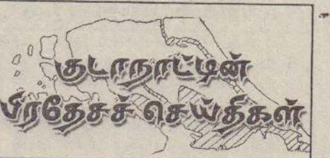
குடாநாட்டின் பிரதேசச் செய்திகள்