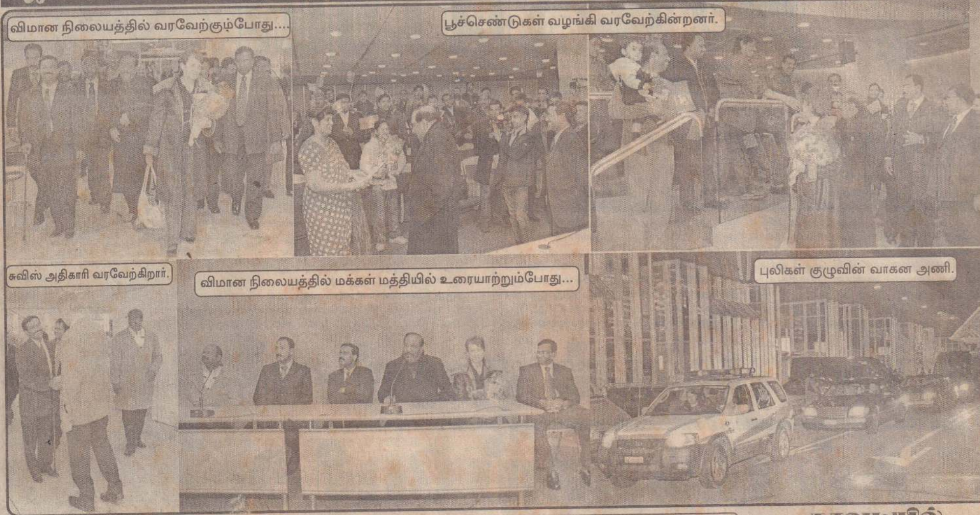
விமான நிலையத்தில் வரவேற்கும்போது...