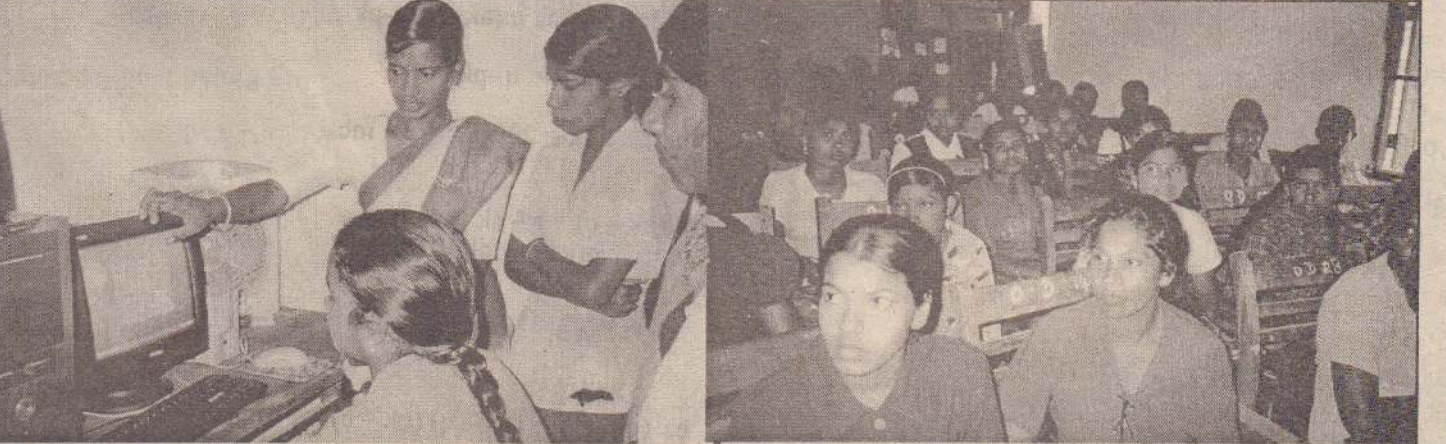
முல்லைத்தீவு மாவட்டப் பெண்கள் அபிவிருத்தி புனர்வாழ்வு சிறுவர்களுக்கும் புதன், செவ்வாய், கிழமைகள் பயிற்சி வகுப்பில் ஆசிரியர் ஒருவர் மாணவர்களுக்குச் செயல்முறைப் பயிற்சி வழங்குவதையும் பயிற்சி வகுப்பில் பயிற்சி பெற்று மாணவர்களில் ஒரு பகுதியினர் படங்களில் காணலாம்.