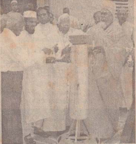
ஆகியோர் உட்பட பலரும் ஏற்றினர்.