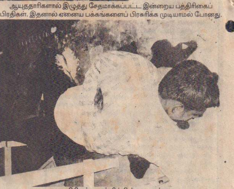
ஆயுததாரிகளால் இழுத்து சேதமாக்கப்பட்ட இன்றைய பத்திரிகைப் பிரதிகள். இதனால் ஏனைய பக்கங்களைப் பிரசுரிக்க முடியாமல் போனது.