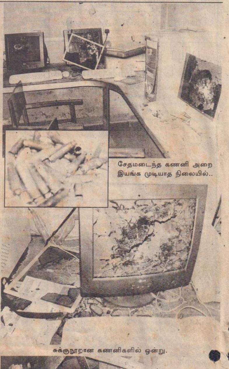
சேதமடைந்த கணினி அறை இயங்க முடியாத நிலையில்..

அவர் மேலும் தெரிவித்தார். அப்பகுதியில் பின்னர் சந்தேகத்துக்கு இடமான இருவரைப் படையினர் கைது செய்து பொலிஸாரிடம் ஒப்படைத்தனர் என்றும் அவர் கூறினார்.