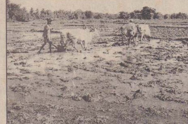
வண்ணிப் பெருநிலப்பரப்பில் எரிபொருள் தட்டுப்பாடு நிலவுகிறது. இதனால் உழவு இயந்திரப் பயன்பாடு குறைந்தன விலையே இடம்பெறுகிறது. உழவு இயந்திரத்துக்குப் பதிலாக விவசாயிகள் மாடுகளைப் பயன்படுத்த ஆரம்பித்துள்ளனர். முல்லைத்தீவு மல்லாவிப் பகுதி வயலொன்றில் விவசாயிகள் ஏர் பூட்டி உழுவதைப் படத்தில் காணலாம்.